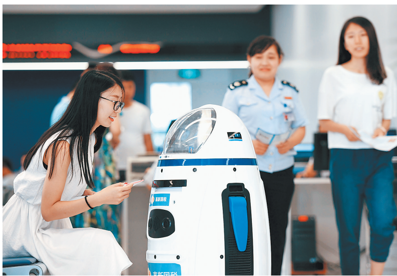
近日,在石家庄高新区国地税联合办税服务厅,造型可爱的机器人“税小高”正在为企业代表提供办税咨询服务。税小高是省税务系统首次引进的辅助办税机器人,它能将纳税人引领到所需办理业务的相应窗口,还可以通过人机对话解答相关的税务问题。同时,在大厅人数较多时,还肩负着宣传税收政策的任务。

据了解,演出现场有来自10多家北京媒体和河北省内多家媒体的记者参与现场报道,近3000名当地群众冒雨观看了演出。