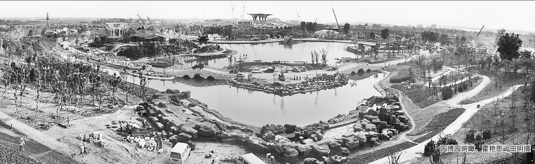
园博园俯瞰。