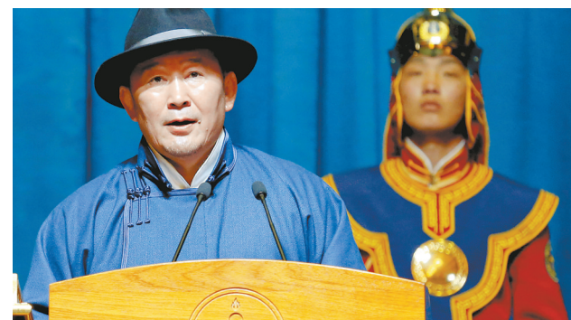
7月10日,巴特图勒嘎出席就职仪式。

据新华社乌兰巴托7月10日电(记者阿斯钢)蒙古国新总统巴特图勒嘎10日在首都乌兰巴托国家宫宣誓就职。