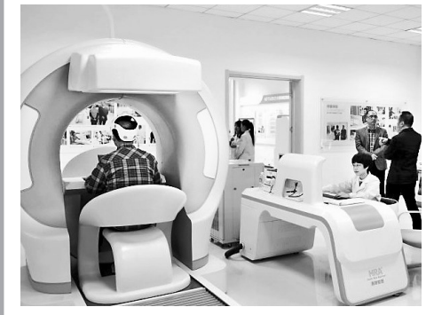
客人体验惠斯安普公司的HRA健康风险评估系统。

《健康中国2030规划纲要》使健康中国建设上升为国家战略,这对于看好中国健康产业发展前景的人来说是个大惊喜。惠斯安普医学系统股份有限公司董事长陈志林也没有料到,自己早在2008年的一次跨界选择,在眼前打开的竟然是如此开阔的一湾蓝海。把功能医学技术设备研发作为企业的主攻方向,针对健康和亚健康人群需求做好产品的发展战略,不仅成功避开了与现有医疗器械企业,尤其是国际品牌企业打遭遇战的风险,也为自己争取到了更大的发展空间。惠斯安普全生命周期、全产业链布局健康产业创新技术,恰好为国民健康管理各个层面的需求提供了全套解决工具包,所引发的各种运营模式和创新成果,正在全国范围呈罗棋布,惠及更多百姓。