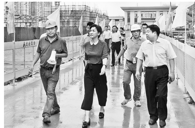
近日,磁县人大大委综合执法检查组到该县督导检查大气污染防治一法一条例情况进行检查。图为执法检查组在冀南新区玖号院建筑工地实地查看。

省人大常委会审议认为,我省法治化建设比较滞后,履约践诺的社会信用环境还有待完善和加强。应强化信用体系建设,加快推进营商环境法治化。全面加强诚信体系建设,加大信用信息记录、披露、约束工作力度,加大对诚信主体激励和对失信主体惩戒力度,大力营造向上向善、守信践诺的良好社会风尚。突出政务诚信建设重点,强化履约承