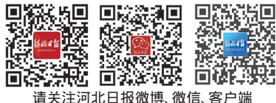
请关注河北日报微博、微信、客户端

新华社北京7月24日电 中共中央7月21日在中南海召开党外人士座谈会,就当前经济形势和下半年经济工作听取各民主党派中央、全国工商联负责人和无党派人士代表的意见和建议。中共中央总书记习近平主持座谈会并发表重要讲话。