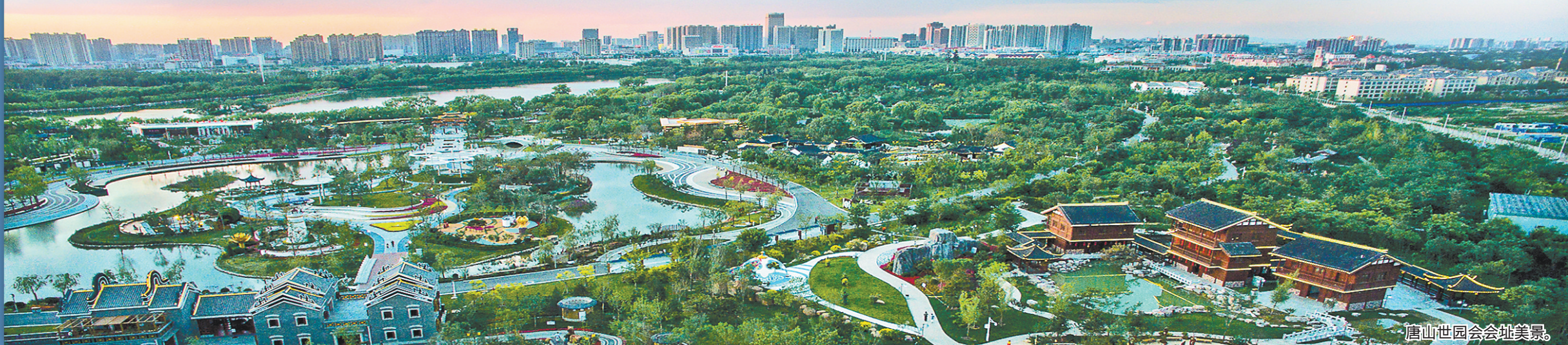
唐山世园会会址美景。