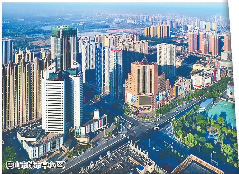
唐山市城市中心区。