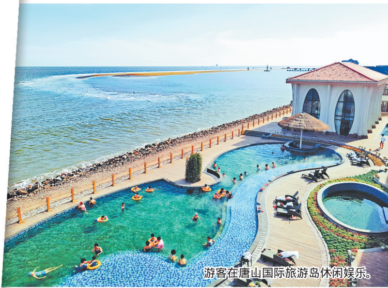
游客在唐山国际旅游岛休闲娱乐。