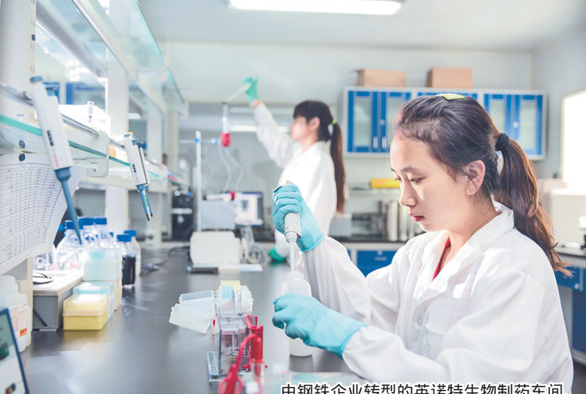
由钢铁企业转型的英诺特生物制药车间。