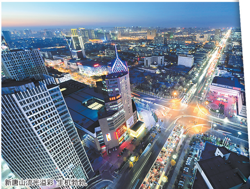
新唐山流光溢彩 生机勃勃。