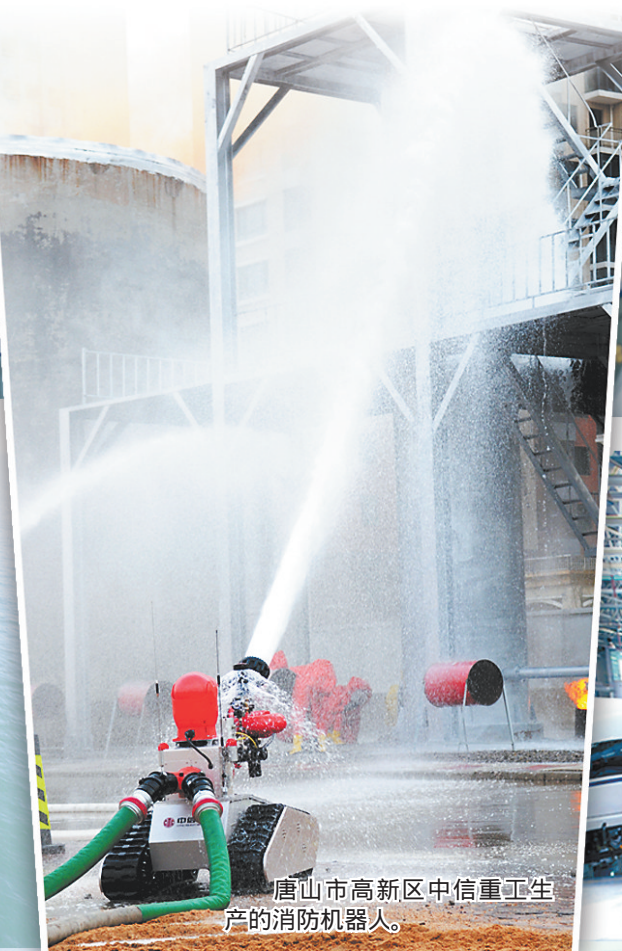
唐山市高新区中信重工生产的消防机器人。