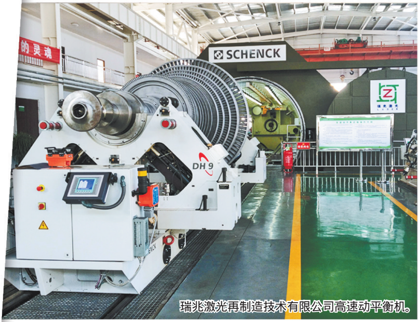
瑞兆激光再制造技术有限公司高速动平衡机。