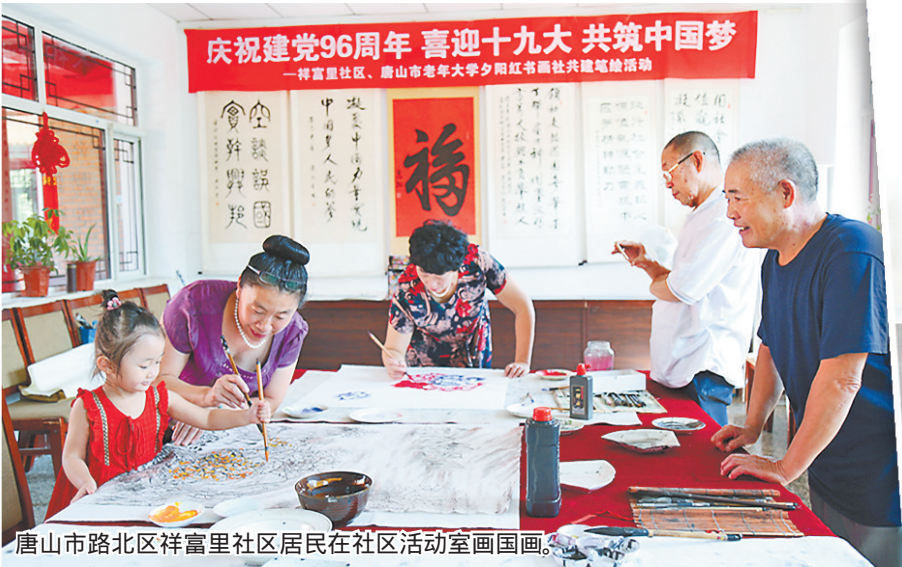
唐山市路北区祥富里社区居民在社区活动室画国画。