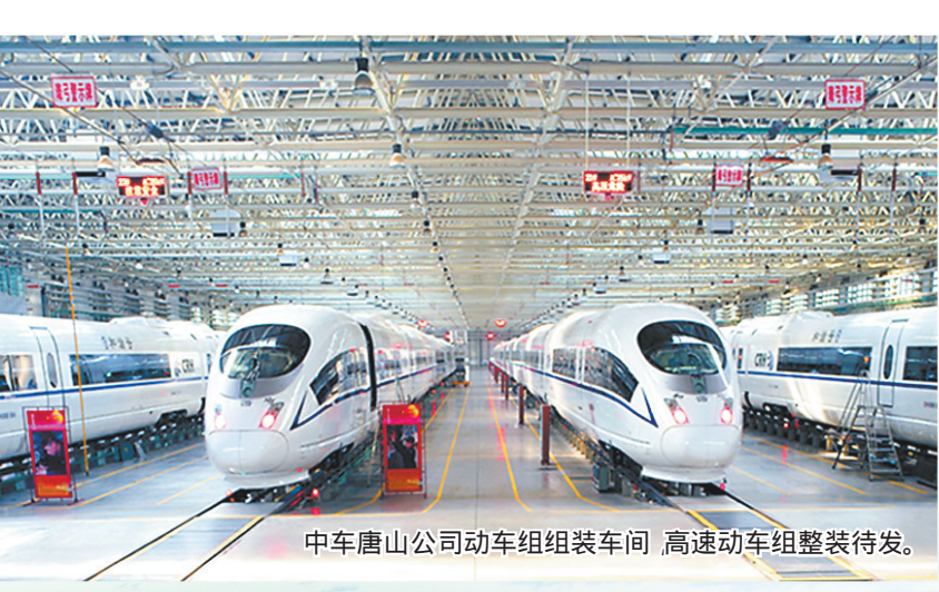
中车唐山公司动车组组装车间,高速动车组整装待发。