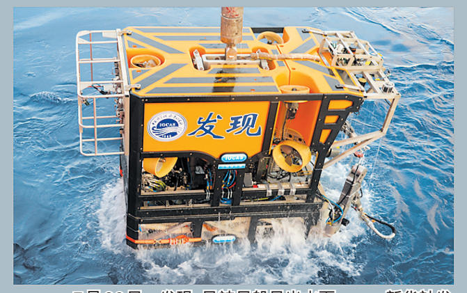
7月26日,发现号被母船吊出水面。