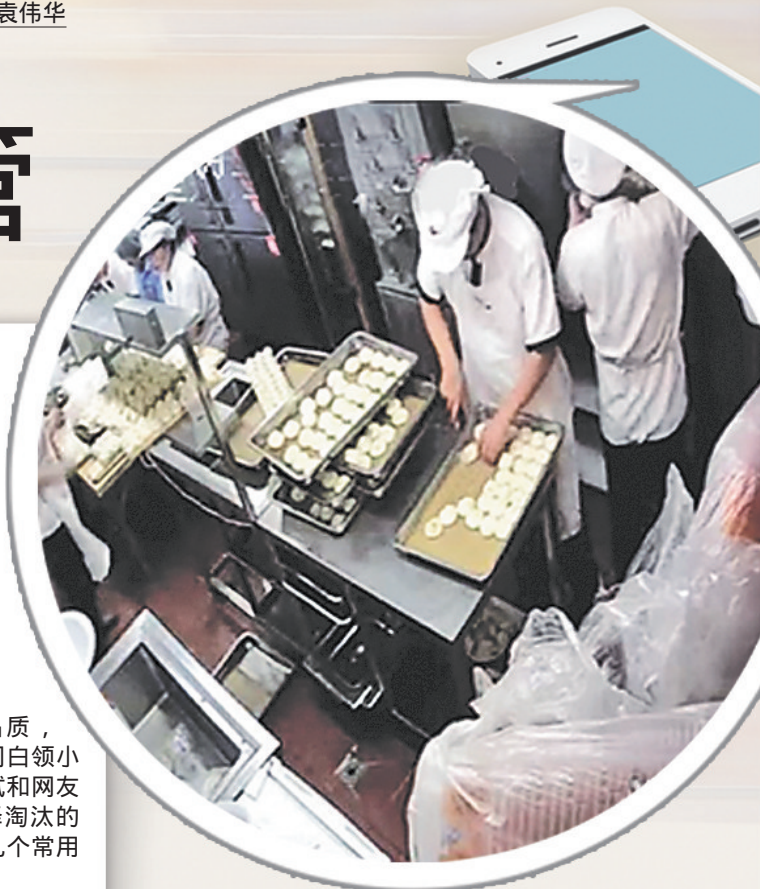
7月26日,一家餐饮企业的阳光厨房正在进行视频直播,消费者可通过手机监督。

取、制作程序、加工环境等方面都有保障。乔女士说,目前网络订餐的第三方平台,一般都会对入驻商家进行资质审核,不过也有店铺网上的图片看上去整洁有序,但实体店管理混乱。这一点普通消费者是很难核实的。 至于如何评判外卖的品质,使用网络订餐频率极高的公司白领小白表示,只能通过自己的尝试和网友们的口碑评价,有一个选择淘汰的过程,最终每个人都会留下几个常用的商家,成为回头客。