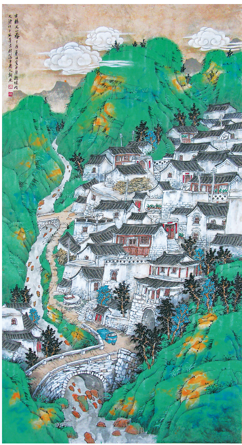
《古镇又一春》 段朝林