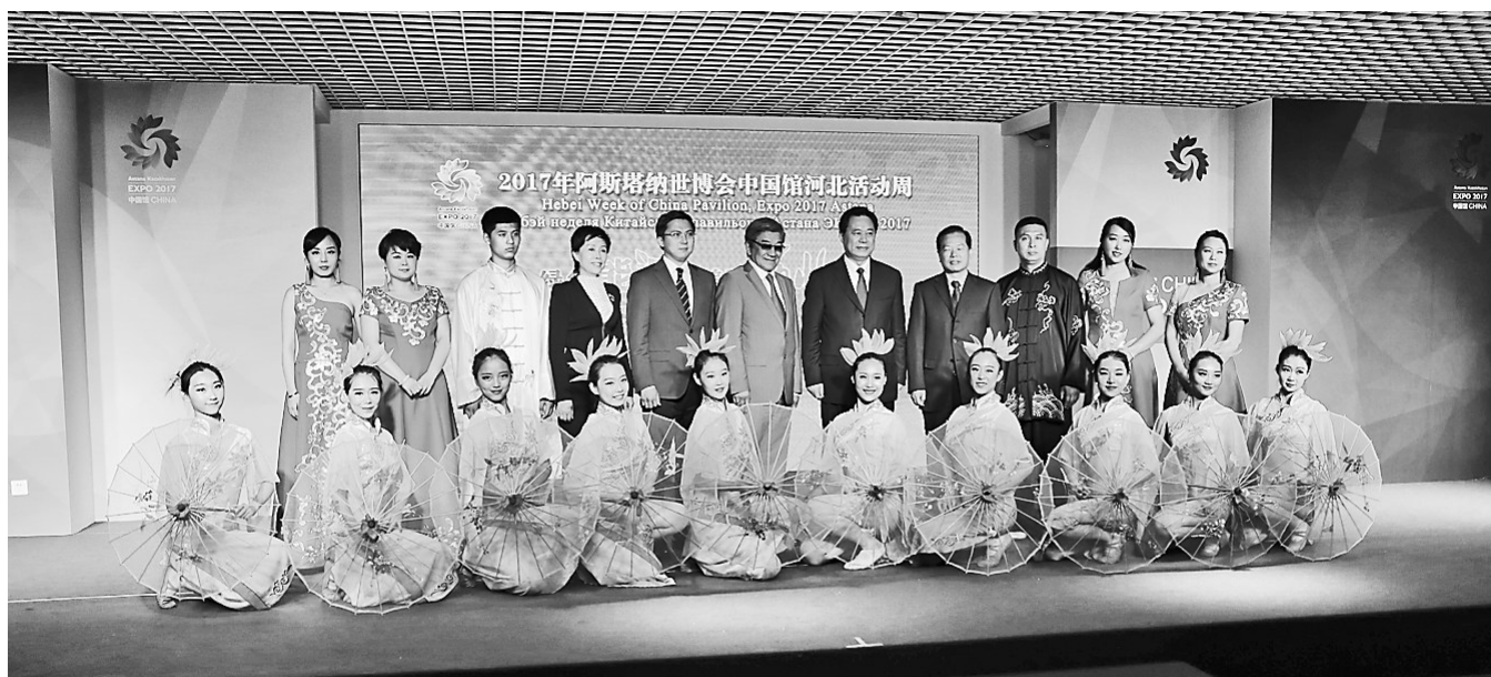
7月14日,阿斯塔纳世博会中国馆河北活动周精彩亮相。

哈萨克斯坦企业家联合会副主席多斯克诺夫表示,中哈建交25年来,两国关系取得了积极进展。鉴于企业家之间的合作日益密切,有必要建立有中哈企业家共同参与的商协会组织。相信在