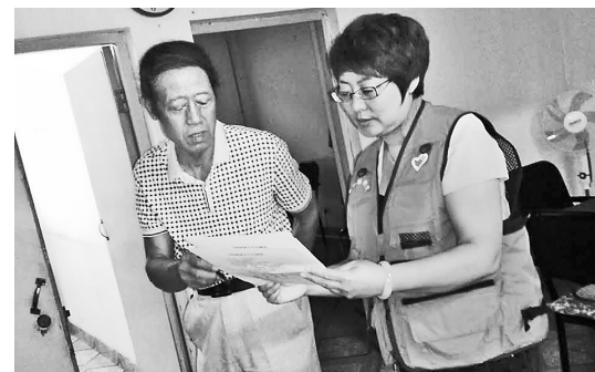
图为近日海港区东环路街道办事处的工作人员(右)到居民家中宣传创城知识。

本报讯(记者宋柏松 通讯员张宏宇)自秦皇岛市开展全国文明城市创建工作以来,各单位干部职工走入千家万户开展创城宣传,提高创建文明城市的知晓度,并主动征求群众的意见和建议,让人人行动起来,参与到创城中来。