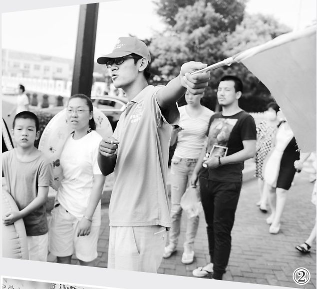
②东北大学秦皇岛分校的志愿者(左三)在路口协助交警指挥非机动车和行人按照交通信号灯有序通行。