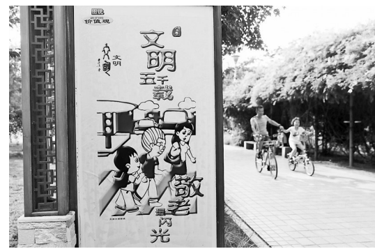
图为海港区新世纪公园内宣传社会主义核心价值观的展板。

本报讯(记者宋柏松 通讯员吕红梅)近年来,在创城的过程中,秦皇岛市从细微处入手,全方位多载体宣传社会主义核心价值观。