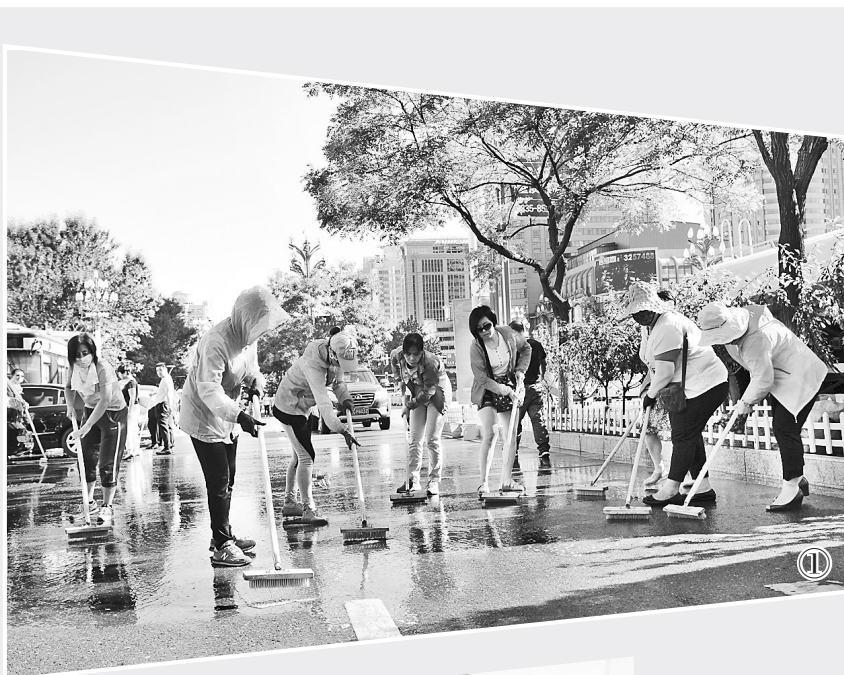
①志愿者们清洁路面。

2016年,秦皇岛市委、市政府向全市人民发出“坚定不移创建,任有千难万险”的创城动员令,把创建全国文明城市作为利民惠民的大事来认识和推动。秦皇岛成立创建全国文明城市总指挥部,市委书记、市长任指挥长,下设14个由市级领导牵头的创建组,牵