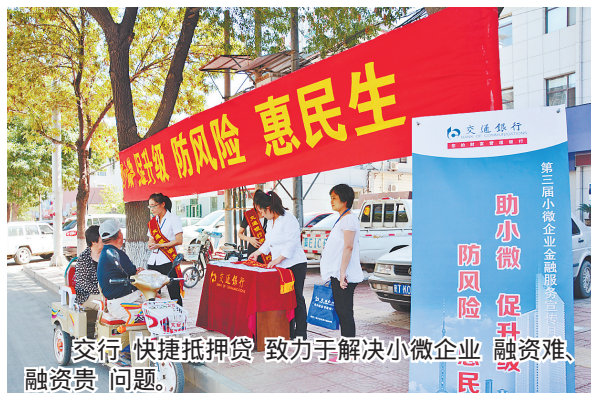
交通银行快捷抵押贷，致力于解决小微企业融资难、融资贵问题。