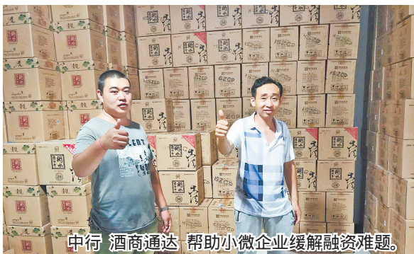
中行酒商通达帮助小微企业缓解融资难题。