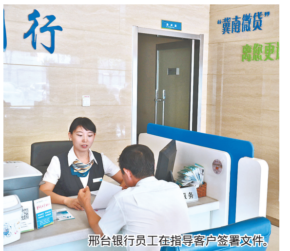
邢台银行员工在指导客户签署文件。

邢台银行 冀南微贷 是该行引进世界先进微贷技术研发的特色贷款产品，致力于解决小微企业、个体工商户的融资难题，具有 高效、便捷、无杂费、无抵押 的特点。 服务对象 资金需求紧急、没有合适抵押物的小微企业、个体工商户。 贷款期限 3个月至2年。 贷款利率 实行浮动利率，最低可至6。 授信额度 5000元至200万元。具体额度根据经营情况合理确定。 业务特点 3个工作日内给予答复，不需要借款人提供规范的财务报表，除利息外，无任何费用，无须提供抵押，只要有一个有稳定收入的个人提供担保即可。 申报条件 从事贸易或服务行业的只要有3个月以上的正常经营历史，从事生产加工行业的只要有6个月以上的正常经营历史，即可带上相关证件申请。 办理渠道 邢台银行小企业信贷中心各分支中心均可申请办理。 (才春红)