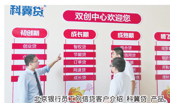
北京银行员工向信贷客户介绍科冀贷产品。

北京银行石家庄分行 科冀贷 是2015年设计出一款致力于解决科技企业轻资产、融资难的金融创新产品。 服务对象 适用于高新技术企业和小微科技企业，包括了软件贷、网贷贷、智权贷、节能贷、创意贷等50多款创新子产品。 贷款期限 一般流动资金贷款1年，最长可达3年。 贷款利率 同期限基准上浮30%以内，年化5.7%以内。 授信额度 根据企业发展周期不同，设定不同标准，最高可达10000万元。 业务特点 快速审批、额度灵活、组合担保、线上放款、自主支付，组合担保是结合房产抵押、第三方担保、未来收益权质押等组合担保方式进行操作。 申报条件 具有独立法人资格，经工商行政管理部门核准登记，并办理年检手续，持有中国人民银行核发的年检有效的贷款卡，依法进行税务登记，照章纳税，成立时须在2年(含)以上，有固定生产经营场所，员工队伍稳