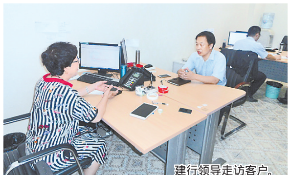
建行领导走访客户。

微企业客户。小微企业的认定标准按国家四部委标准执行。 贷款期限 循环额度有效期最长1年(含)，在核定的有效期内借款人可随时申请支用，单笔支用贷款期限不超过一年，且贷款到期日不超过核定的 商超易贷 循环额度有效期届满之日起180天。 贷款利率 按照收益覆盖风险和成本的原则，根据业务申请情况实行差别化的风险定价。 授信额度 单户贷款金额最高为500万元(含)。 业务特点 与大型商超合作，为场内小微企业服务，客户群锁定、目标客户明确，借款人在授信额度内，随借随还、循环使用，无需抵押、信用放款。 申报条件 企业连续经营满三年或实际控制人有三年以上本行业从业经验，企业与核心商超连续合作2年(含)以上，无违约记录，企业生产经营连续稳定，有盈利预期，产品和服务有市场，具有固定、成熟的购销和推广渠道等。 办理渠道 建设银行指定营业网点专门服务。 (李朋)