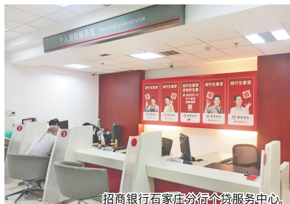
招商银行石家庄分行个贷服务中心。

招商银行石家庄分行小微企业贷款 周转易 大力支持小微企业、个体工商户，具有省息、省时、省事的特点。 服务对象 小型、微型企业及个体工商户。 贷款期限 小微抵押贷款期限最长可达10年。 贷款利率 小微抵押贷款基准利率上浮55%-75%(视借款人资质、抵押物价值综合评定)。 业务特点 随借随还、按日计息；一次办理、多次使用；在授信额度正常期间，可持续使用周转易产品，免除重复提交资料的繁琐流程。 授信额度 授信或单笔贷款金额不超过500万。具体授信金额根据借款人资质、抵押物及其他基本条件综合评定。 申报条件 合法经营的小型、微型企业及个体工商户(不含部分产能过剩等禁入行业) 营业执照1年以上；信用良好，征信记录符合准入要求；具备按时偿还贷款本息的能力。