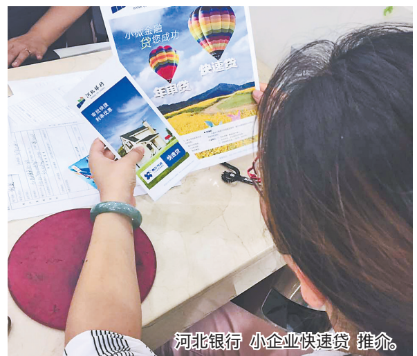
河北银行小企业快速贷推介。

河北银行 小企业快速贷 主要解决了小微企业用款急和频的需求，针对小微企业经营特点，无需客户提供财务报表的，一款以住宅抵押的小微企业贷款产品。 服务对象 主要服务于成立一年以上，生产经营正常，有合理贷款需求的小微企业和个体工商户。 贷款期限 贷款期限一般3年，最长不超过5年。 贷款利率 按客户风险程度确定贷款利率，一般在6%左右。 授信额度 贷款金额最高300万元。 业务特点 资料简单，审批快速，一般审批时间为3-5天，最快可当天完成审批，用款灵活，可循环使用，贷款成本低，除贷款利息外不收取任何费用。 申办条件 具有合法有效的营业执照及有固定经营场所，持续正常经营一年以上，经营状况良好，能够提供自有或近亲属住宅抵押。 办理渠道 河北省内及天津、青岛两市内任意一家河北银行网点均可申请办理。 (韩丽辉)