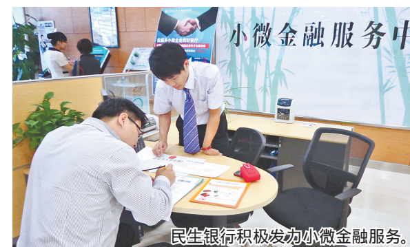
民生银行积极发动小微金融服务。

中国民生银行石家庄分行 小微抵押贷款 是面向小微企业客户发放的，以我行认可的住宅、商铺为抵押担保，向我行申请经营性人民币贷款，并按约定偿还本息的授信业务。 服务对象 个体经营者、小微企业、小微企业股东或实际控制人。 贷款期限 期限最长可达20年，客户贷款资金使用得到保证，同时也有效降低贷款风险成本。 贷款利率 对优质小微客户和优质抵押物实行利率最低上浮30%。 授信额度 贷款金额不超过抵押房屋评估价值的70%，贷款金额最高可达500万。 业务特点 贷款可转期，倒贷不交息，可选择 每月还息，到期还本 等额本息 等额本金 等多种还款方式，客户根据自身特点灵活掌握，保证还款规律，避免不良信用记录产生，同时大幅降低了贷款的整体还款成本。 申报条件 经营2年以上的小微企业或个体经营