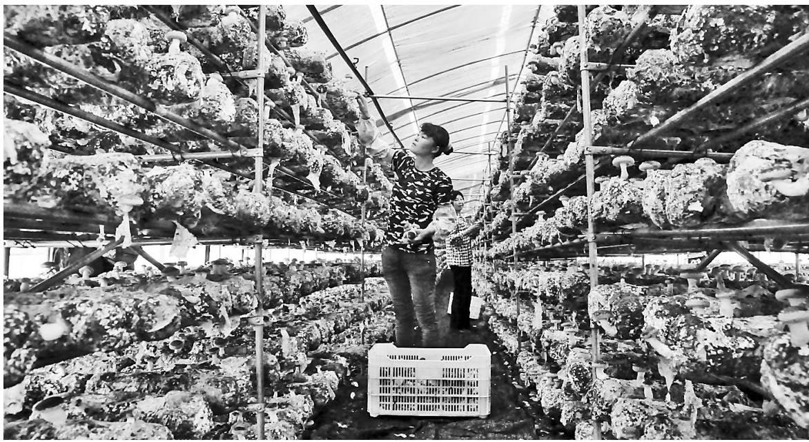
近年来,赤城县三道川德康公司农光互补扶贫光伏发电项目,装机容量达到16兆瓦。他们棚内种植蘑菇,棚顶光伏发电,实现了光能和土地的集约化、立体化综合利用,让农业种植实现绿色、高产、高效。图为工人在食用菌光伏大棚内采摘香菇。

本报讯(记者刘雅静 通讯员顾瑛鑫)近日,张家口市桥东区域城管局联合京环桥东公司在冠垣广场、汉庭酒店等小型餐饮业密集区域配备了10个餐厨垃圾专用桶,作为整治乱泼乱倒餐厨垃圾首批试点,实现了餐厨垃圾专用桶回收统一清运。为使餐饮单位、商铺严格执行倾倒规定,该区域城管执法人员和城管志愿者在小型餐饮业密集区域逐户上门宣传,引导商家将餐厨垃圾统一倾倒入餐厨垃圾专用桶中。京环桥东公司每天下午和晚上定时对投放的10个餐厨垃圾专用桶进行清理。经过10余天的运行,大部分商家已严格按照规定倾倒餐厨垃圾。