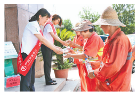
农行承德分行双塔山支行营业室为环卫工人送服务