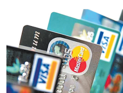
信用卡被盗刷多因信息泄露 卡债账单有疑问可投诉