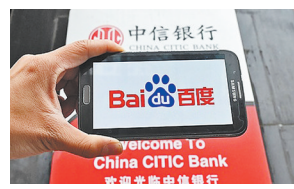
全国首家直销银行 主打智能普惠金融