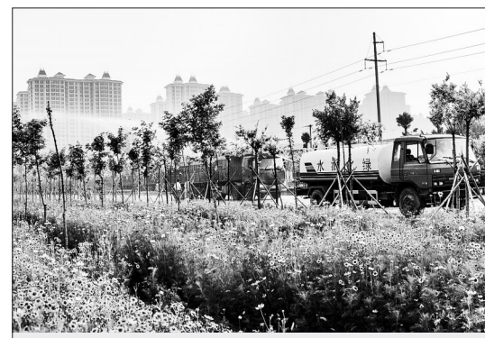
近日,辛集市交通局农村公路管理处的工作人员在为安新线(安国至新河)公路两侧的绿化带洒水灌溉。该处在绿化工作中注重提升绿化品质,丰富植物多样性,在安新线两侧共种植树木25800多株,花草组合421亩,让安新线成为一道靓丽的风景线。