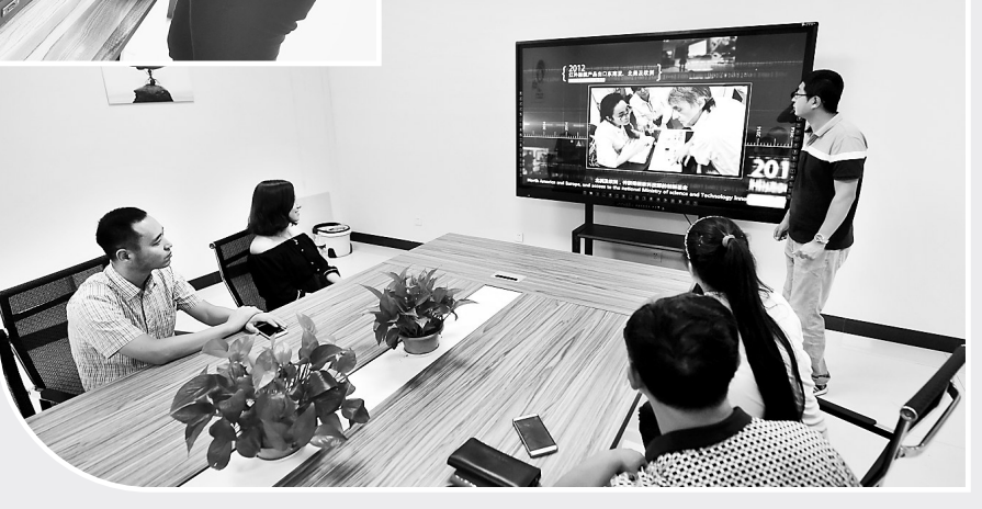
日前,在辛集市科技孵化中心内,河北慧华教学设备制造有限公司工作人员在讲解该公司生产的多媒体交互触摸一体机。据悉,辛集市科技孵化中心是集科研、中试、生产、办公、展厅于一体的综合性科技企业孵化器,为企业提供政策、管理、法律、财务、融资等方面服务,降低企业的创业风险和创业成本,培养成功的科技企业和企业家。