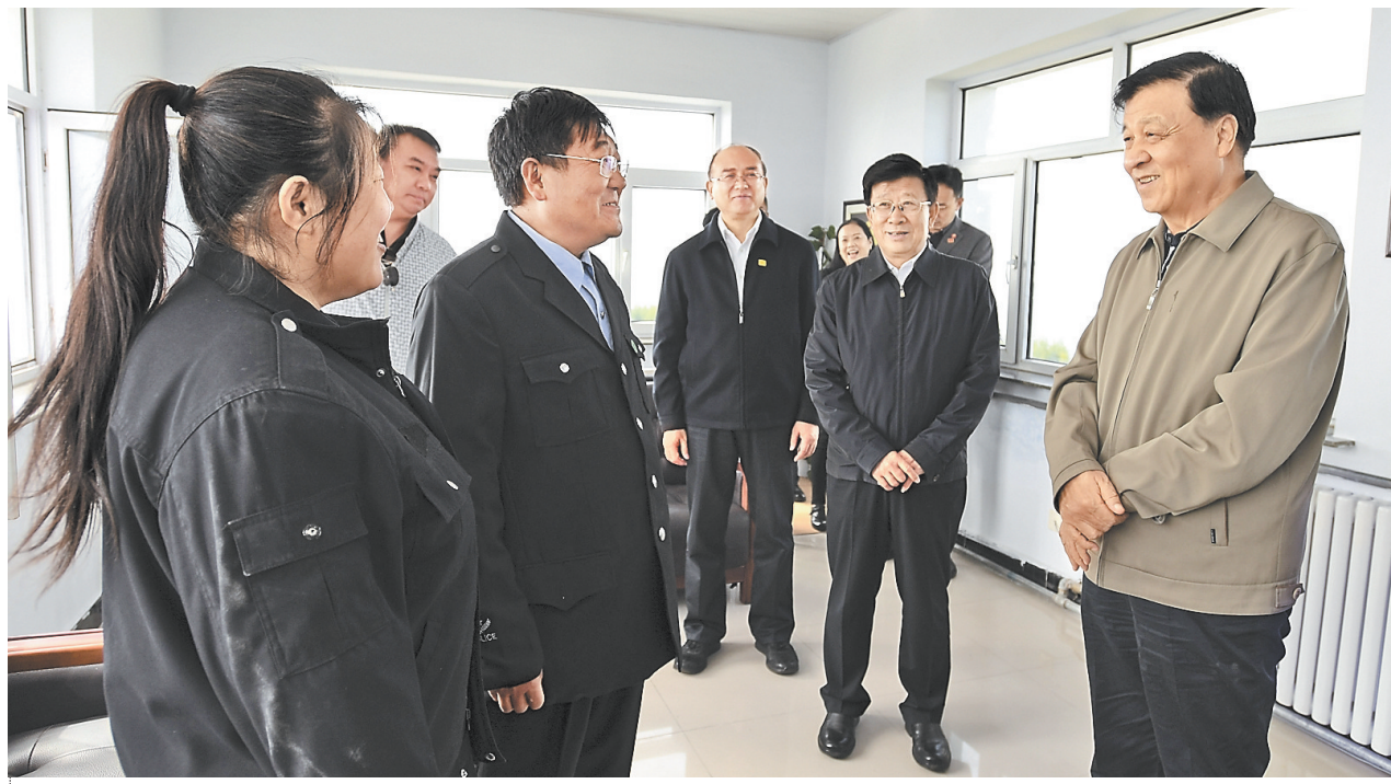
9月3日至4日,中共中央政治局常委、中央书记处书记刘云山在河北调研。这是9月4日,刘云山来到阴河林场看望驻守望海楼的护林员夫妇。新华社发

在滦平古城川村,刘云山详细了解党员干部作用发挥情况,并走进村民家中就脱贫致富奔小康进行交流。老百姓由衷称赞党的十八大以来的惠民政策,对党的十九大充满信心和期待。刘云山说,党员干部应当牢记党的根本宗旨,时时处处走在前面,真心实意为群众办实事解难事,把先锋模范作用发挥好。要抓好党建促脱贫攻坚,选优配