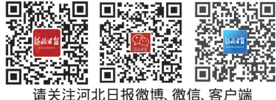
请关注河北日报微博、微信、客户端

对接发展战略;深化政治安全合作,增进战略互信;将人文交流活动经常化、机制化,加深五国人民相互了解和友谊;与时俱进加强金砖机制建设,为各领域合作走深走实提供坚实保障。各国领导人决心以厦门会晤为新起点,共同打造更紧密、更广泛、更全面的战略伙伴关系。(下转第二版)