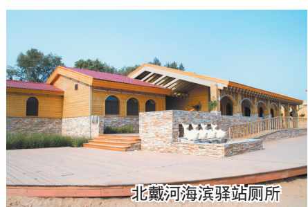
北戴河海滨驿站厕所

区”旅游城镇、旅游景区(点)服务驿站、旅游咨询集散服务体系,推动各市区和全域旅游示范区创建单位建设游客集散中心,加大旅游道路指示牌覆盖,推进高速公路服务区拓展旅游功能。持续深入推进“旅游厕所革命”,把“厕所革命”从城市扩展到农村,从景区扩展到旅游通道沿线、交通集散点等地。同时,开展城镇、乡村和道路沿线旅游环境整治行动,改善城乡环境。