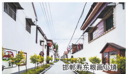
邯郸秀东粮画小镇

省政府的决策部署,全力支持庆功台村实施旅游扶贫战略,建设旅游风景道、停车场、赏花栈道、旅游厕所等设施,把村庄打造成了一个休闲度假的好去处,不仅生活环境风景如画,村民们还有每亩地3000元以上的莲藕收成以及售卖旅游商品、发展农家乐带来的丰厚收入,有的村民还发展莲藕深加工当起了老板。