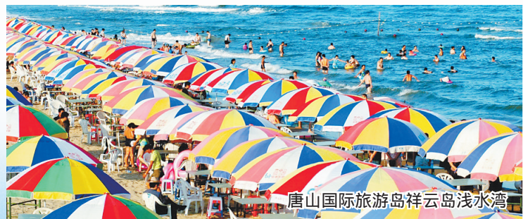
唐山国际旅游岛祥云岛浅水湾

截至7月底,我省旅游项目管理库入库项目1504个,投资规模达17581亿元,实际完成投资额623亿元,分别同比增长85%、166%、107%。我省旅游业实际完成投资额在全国旅游系统排名第四,旅游投资实现倍增翻番,项目建设成效显著。