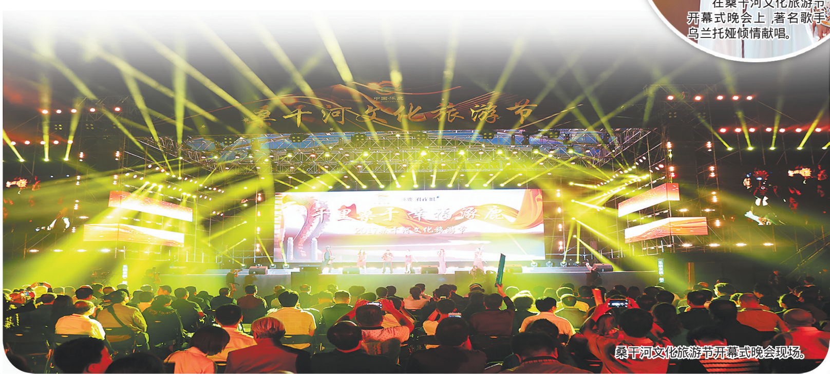
桑干河文化旅游节开幕式晚会现场。