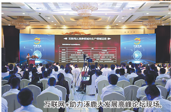
互联网+助力涿鹿大发展高峰论坛现场。