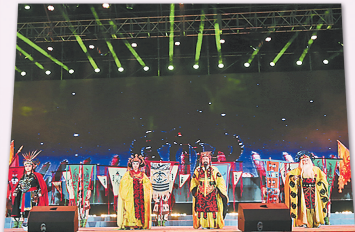
在桑干河文化旅游节开幕式晚会上,口梆子表演《千古文明开涿鹿》。