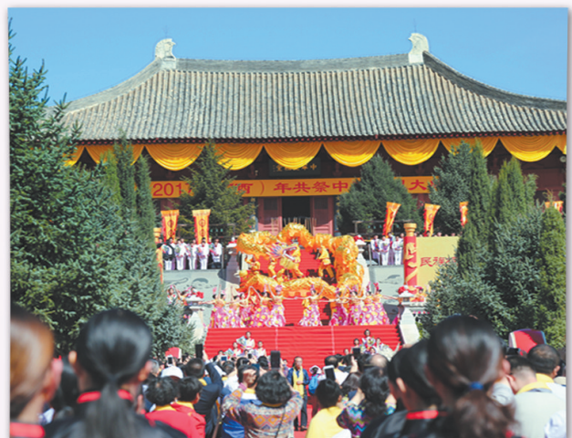
2017(丁酉)年共祭中华三祖大典现场。