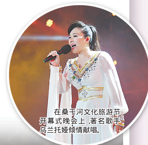
在桑干河文化旅游节开幕式晚会上,著名歌手乌兰托娅倾情献唱。