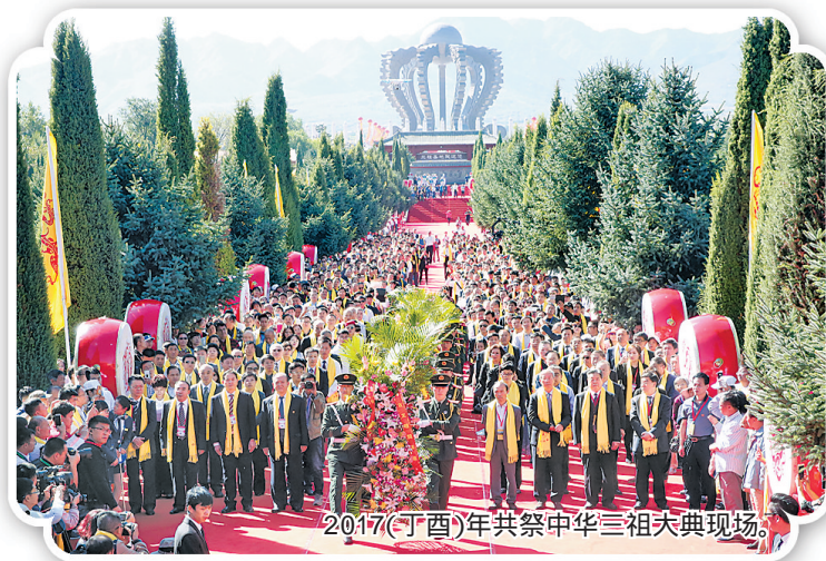
2017(丁酉)年共祭中华三祖大典现场。

地之一。2012年,中央领导同志视察黄帝城文化园区指出,涿鹿是中华文明的重要发祥地,三大人文始祖文化跨越五千年的时空,是中华民族悠久历史的根脉所在。中宣部领导到涿鹿调研后,在《决策参考》专版刊发稿件,把涿鹿评价为讲中国故事的地方,弘扬中国精神的地方,凝聚中国力量的地方,在国家层面进一步肯定了涿鹿始祖文化的历史文化价值和现实意义。中华始祖文化园区被评为全省十大文化产业聚集区,黄帝城景区被列入国家AAAA级旅游景区。