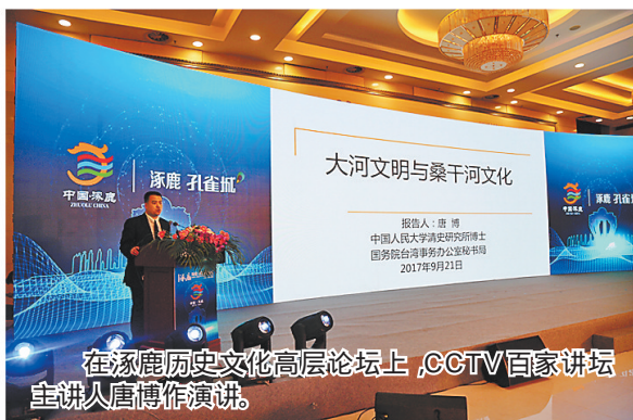
在涿鹿历史文化高层论坛上,CCTV百家讲坛主讲人唐博作演讲。