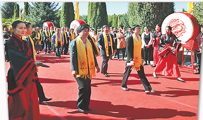
2017(丁酉)年共祭中华三祖大典现场。