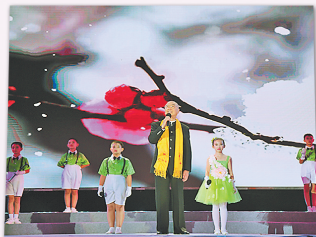
在桑干河文化旅游节开幕式晚会上,著名配音演员乔榛朗诵《致敬顾桑干河的太阳》。