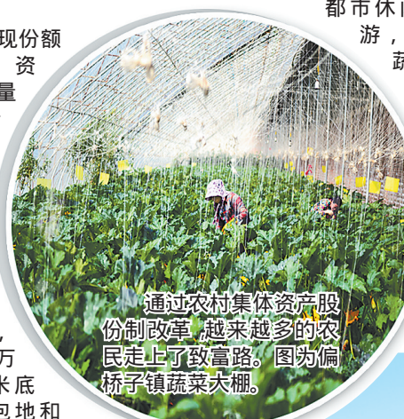
通过农村集体资产股份制改革,越来越多的农民走上了致富路。图为偏桥子镇蔬菜大棚。

攻克登记运营关,实现管理清楚。改制的村集体经济组织,需到工商部门登记注册,并建立完整的公司运营投资、财务预算、收益分配管理、民主监督、审计监督等制度,确保集体资产经营运转安全有效。目前,全区22个村登记注册了股份经济合作社,注册公司(企业)15家,拉动就业近千人。