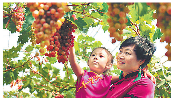
丰收的喜悦,是洋溢在脸上的笑容。图为游客在偏桥子镇达连坑村凤茹采摘园采摘葡萄。

目前,全区63个村改革全面铺开,2.6万名村民入社成为股民,2016年农民人均纯收入10420元,成功蹚出了一条新形势下城郊型农村集体产权制度改革的崭新路径。近期,我省将在双滦区召开关于开展农村集体产权制度改革现场会。