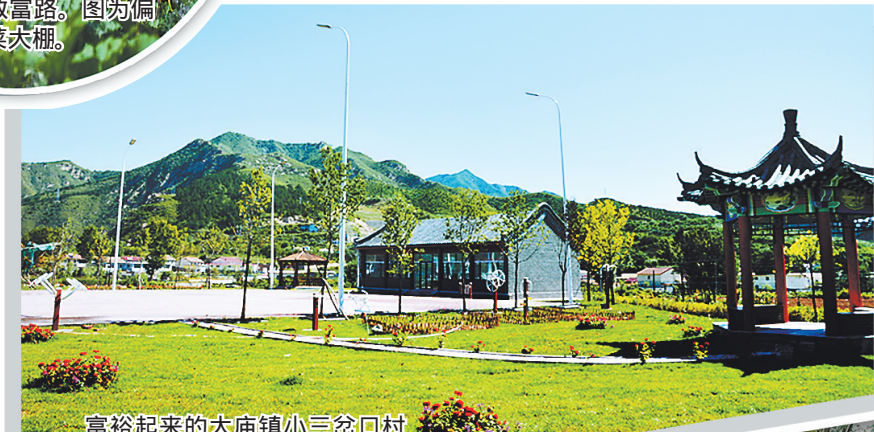
富裕起来的大庙镇小三岔口村建起村史馆及广场。