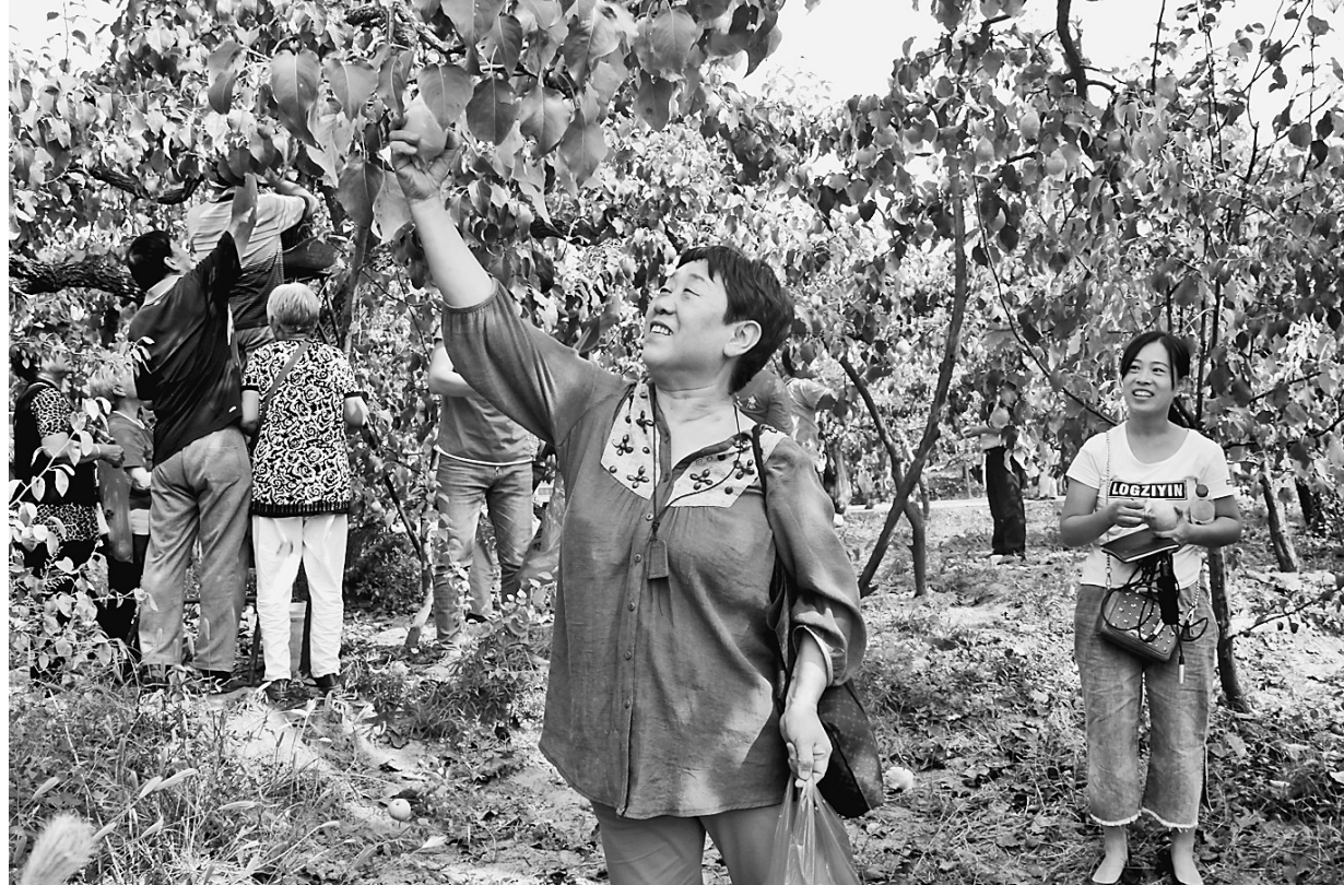
日前，魏縣舉辦第二屆金秋鴨梨採摘節。美丽乡村村鴨梨採摘區共有梨園5000餘畝，預計可產鴨梨2000萬斤，給梨農帶來收益4000萬元。

今年，河鋼邯鄲以高標準客戶需求倒逼產品提檔升級，瞄準國家重點工程拓展銷售市場，成功簽訂直供太行山高速公路建設的9850噸合同大單，並順利完成供貨。