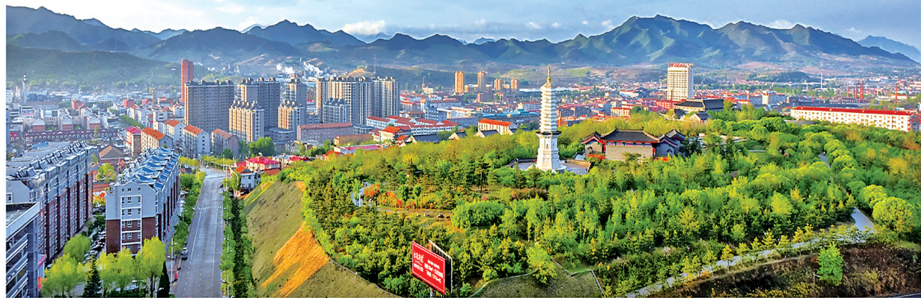
承德稳步推进县城扩容提质，打造有历史记忆、地域特征、山清水秀、宜居宜业的美丽县城。图为平泉市城区全景。