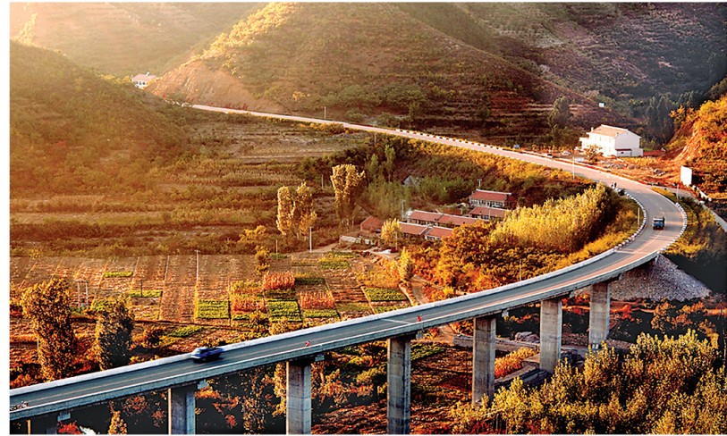
承德全面启动县乡村道路三年攻坚行动，今年开工建设1120公里。图为承秦出海公路尖宝山大桥。