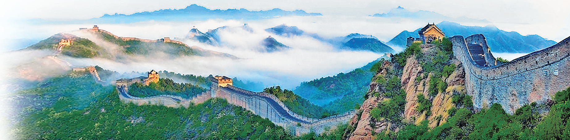
承德市把文化旅游服务业作为第一主导产业打造 增加值占到全市 GDP 的 12%。图为每天吸引大量游客的金山岭长城。