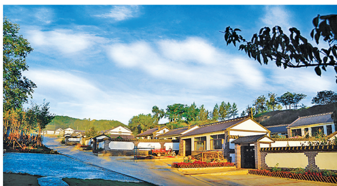
承德坚持脱贫攻坚与乡村特色游、美丽乡村和特色小镇建设、现代农业园区、民俗文化、沟域经济开发“六合一”统筹推进，建设232个旅游示范村。图为哈里哈乡三号村。