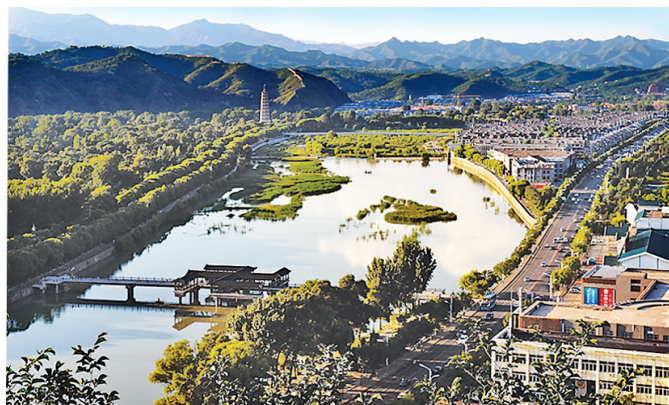
承德加快建设山水园林城市。