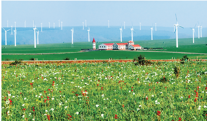
承德加快建设国家清洁能源基地。图为红松洼风电场。