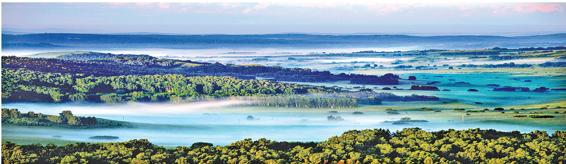
塞罕坝是云的故乡、花的世界、林的海洋。