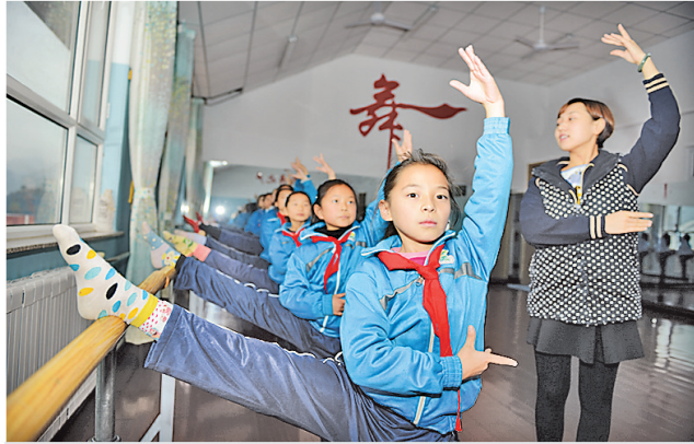
孩子是祖国的未来。为了让农村的孩子们能够享受丰富多彩的课余生活，承德全面启动乡村学校少年宫建设工程。图为学生们在营子区金扇子小学少年宫练习舞蹈。