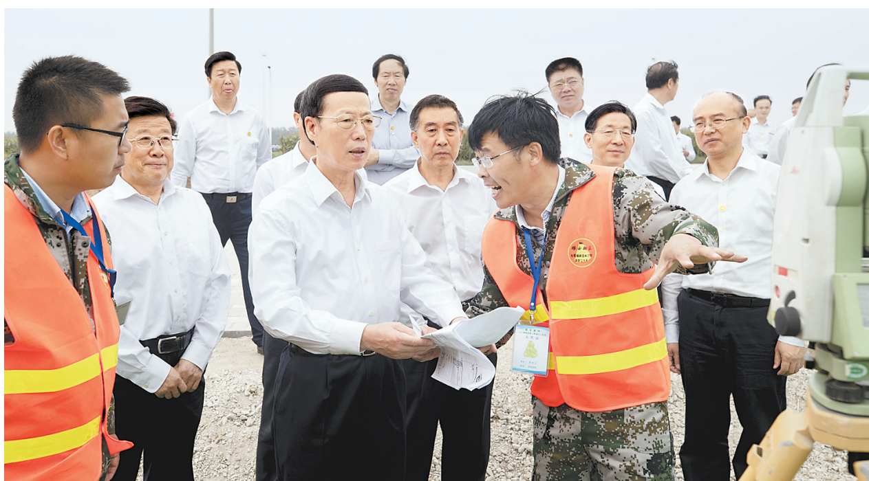
9月26日,中共中央政治局常委、国务院副总理张高丽在河北雄安新区调研规划建设有关工作。这是张高丽考察新区森林城市专项规划情况。

规律、平原建城的要求,体现中西合璧、以中为主、古今交融城市风貌特色,努力编制出经得起历史检验、国际一流的新区规划。要抓紧研究启动对接工作,积极稳妥承接疏解北京非首都功能。要加强与周边地区的统筹协调,努力实现错位发展、协同发展、融合发展。要加快推进交通体系规划建设,促进新区和北京直连直通。要充分体现自然风貌,编制好白洋淀环境治理、成片植树造林和生态保护规划,确