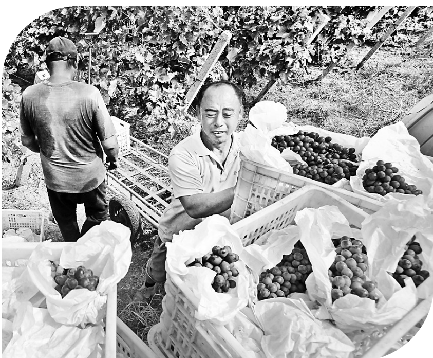
曹妃甸创新农业生态园葡萄喜获丰收,工作人员正在给葡萄装箱。

据了解,有了高品质的产品和良好的销售基础,曹妃甸创新农业生态园也延长了葡萄产业链,发展冷链物流,大力发展绿色旅游、乡村旅游。该生态园已升级为集葡萄文化展览展示、体验采摘、餐饮于一体的多功能葡萄公园,并开发了玫瑰红酒系列,带动当地农户收入提高。