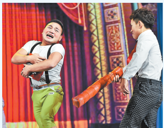
国家艺术基金2016年度资助项目 滑稽表演人才创新能力培养培训班的演员们正在表演节目。