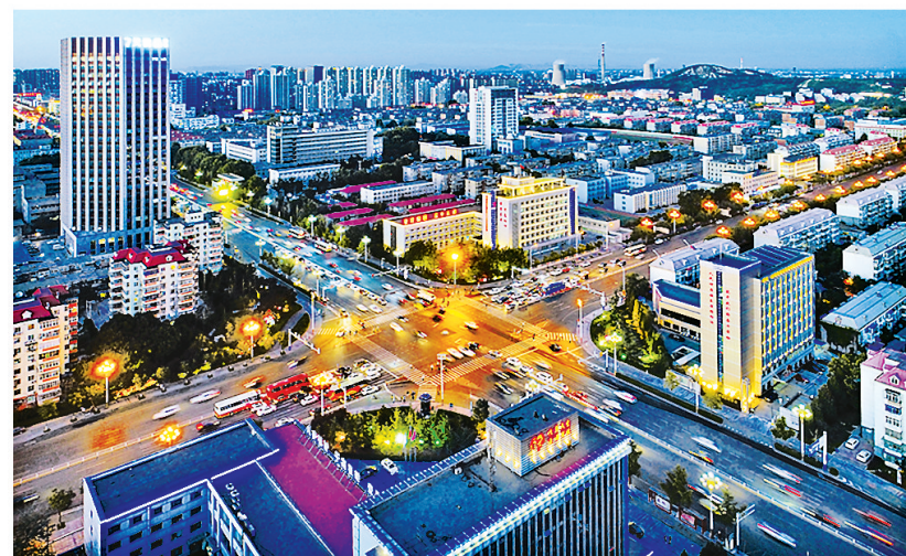
北新道与建设路交口夜景。