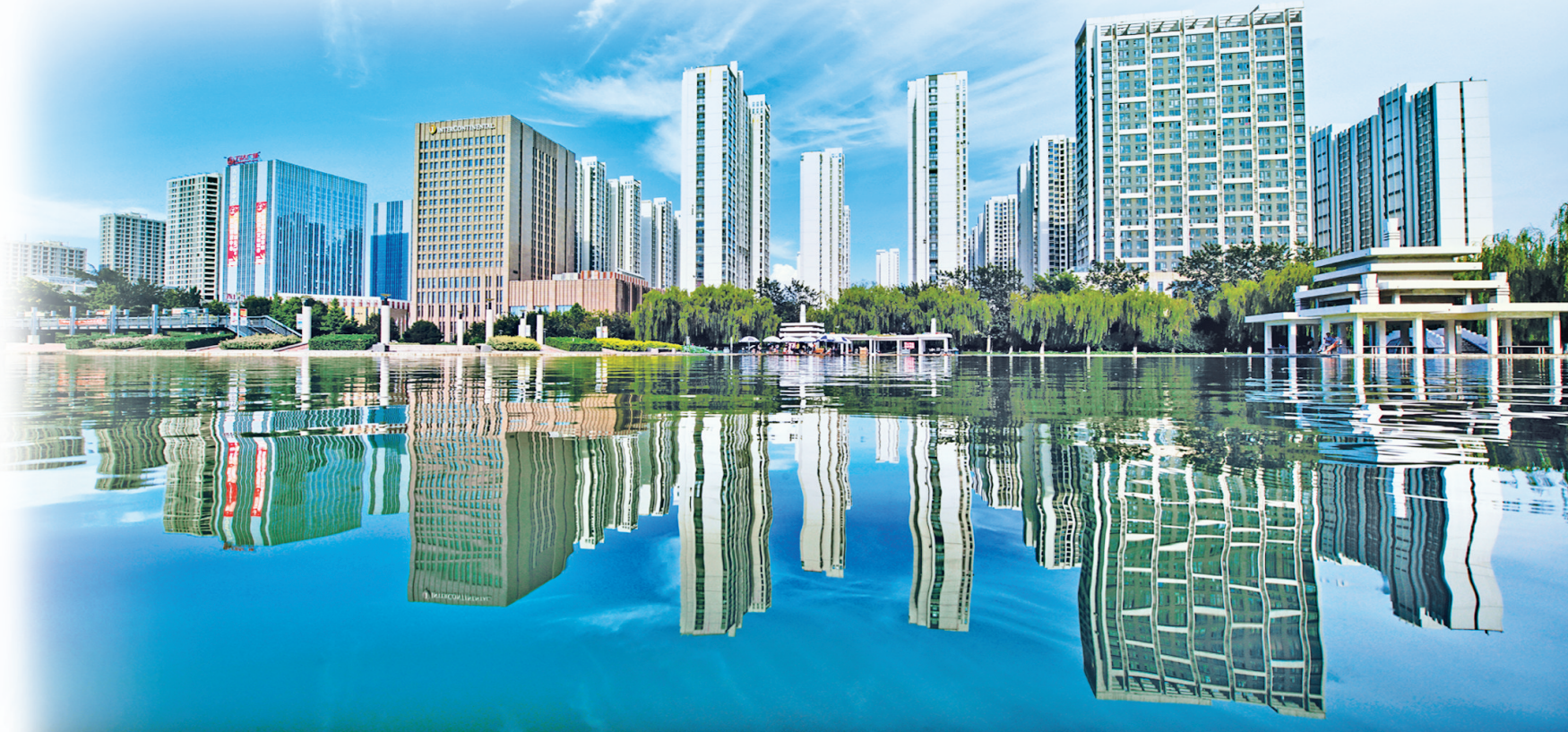
唐山市城市中心区一瞥。