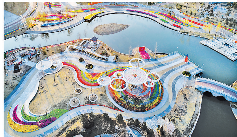
化腐朽为神奇的南湖公园。