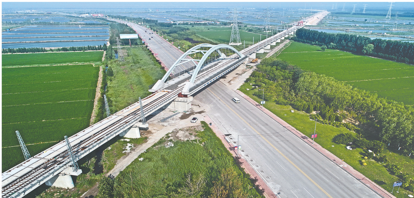
唐曹铁路即将全线贯通。