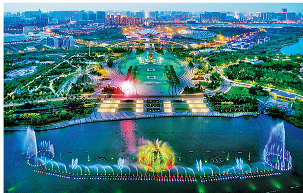
南湖音乐喷泉与市民广场。