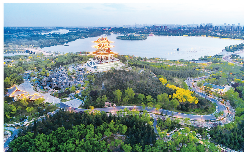
过去的粉末灰排放场如今已经成为南湖龙山风景区。