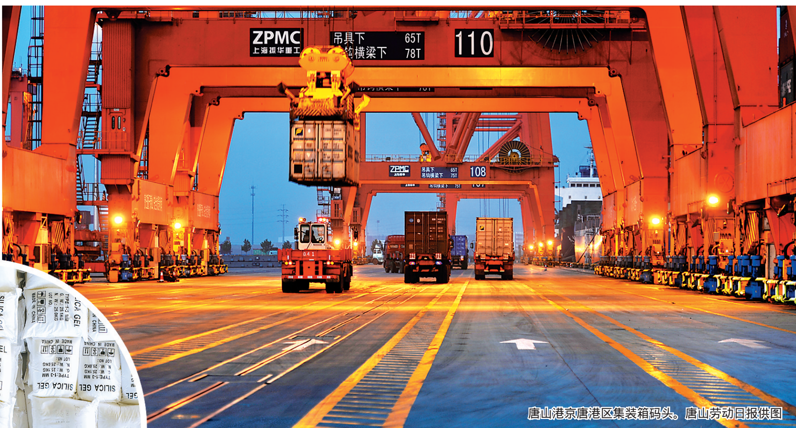
唐山港京唐港区集装箱码头。

在习近平总书记视察唐山时所作重要指示精神的指引下，唐山这座凤凰涅槃的英雄城市，正在朝着建成国际化沿海强市的目标，扬帆远航。