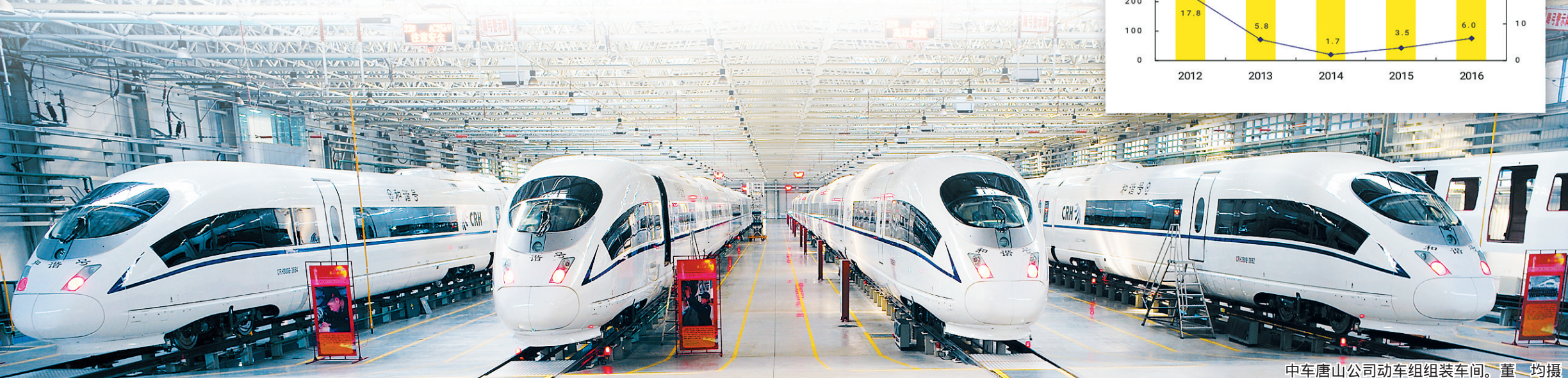
中车唐山公司动车组组装车间。