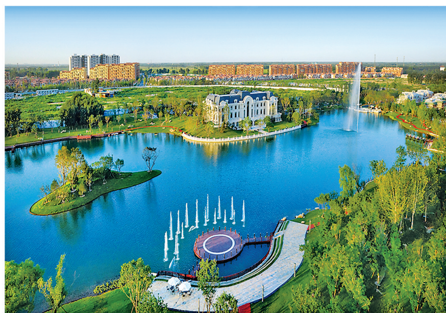
固安孔雀大湖公园。