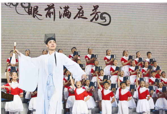
丰富多彩的群众文化活动遍及城乡。