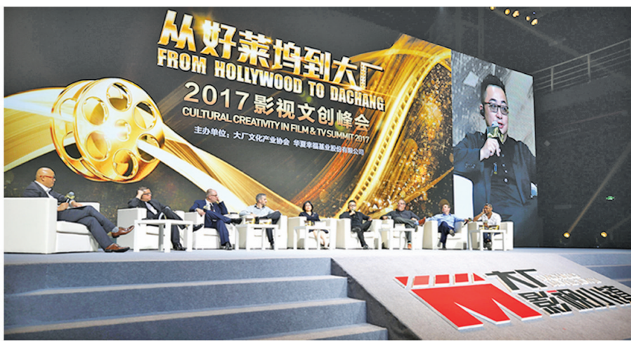
从好莱坞到大厂 2017 影视文创峰会。