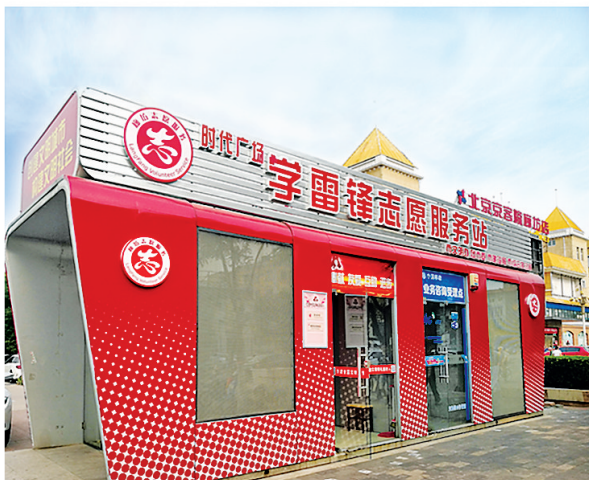
学雷锋志愿服务站遍布市区。