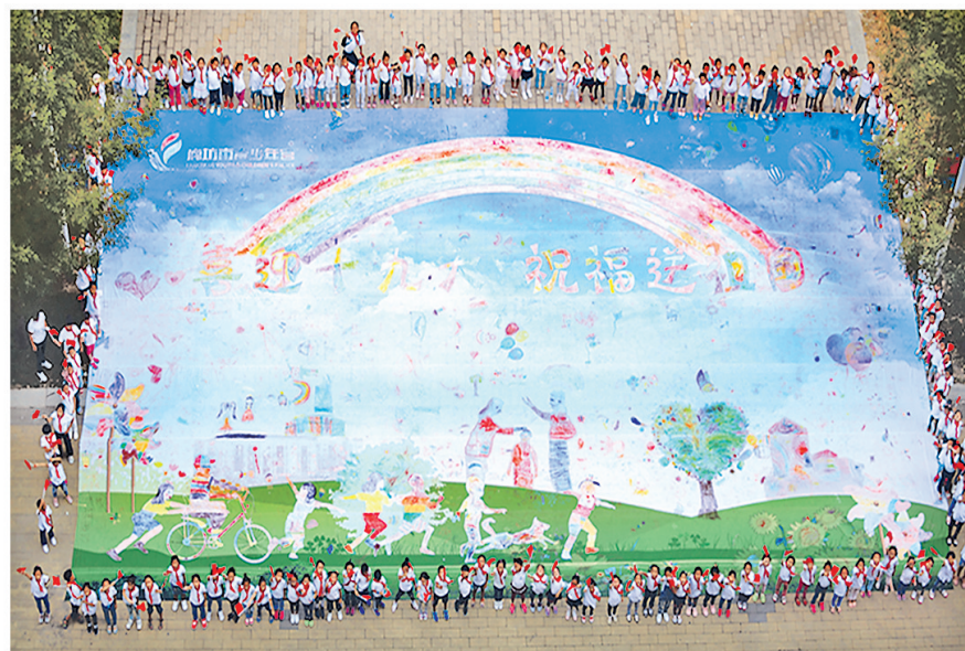
廊坊市百名少先队员共绘“喜迎十九大,祝福送祖国”彩绘长卷。

创新无所不在。在数据中心的云存储平台上,在众创空间飘着的咖啡香气中,在大幅缩减行政审批事项的贴心服务里,当创新的基因融入城市血脉,她的明天注定不同凡响。