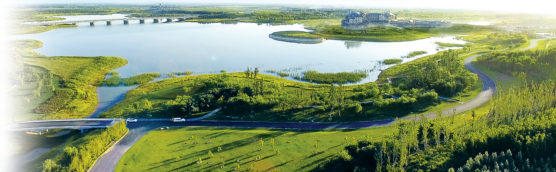
文安鲁能生态区鸟瞰图。