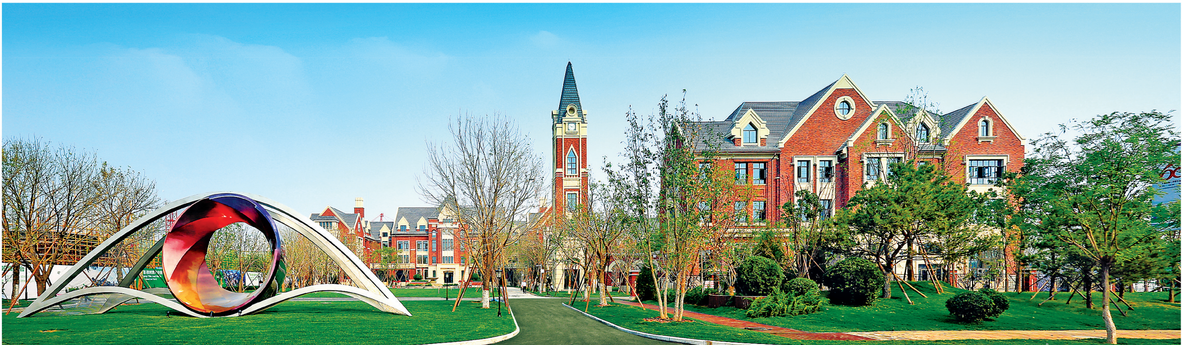
大厂影视创意产业园。