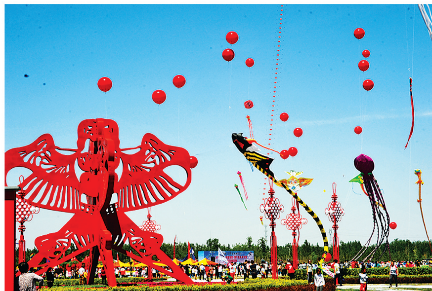
安次区第什里风筝小镇。