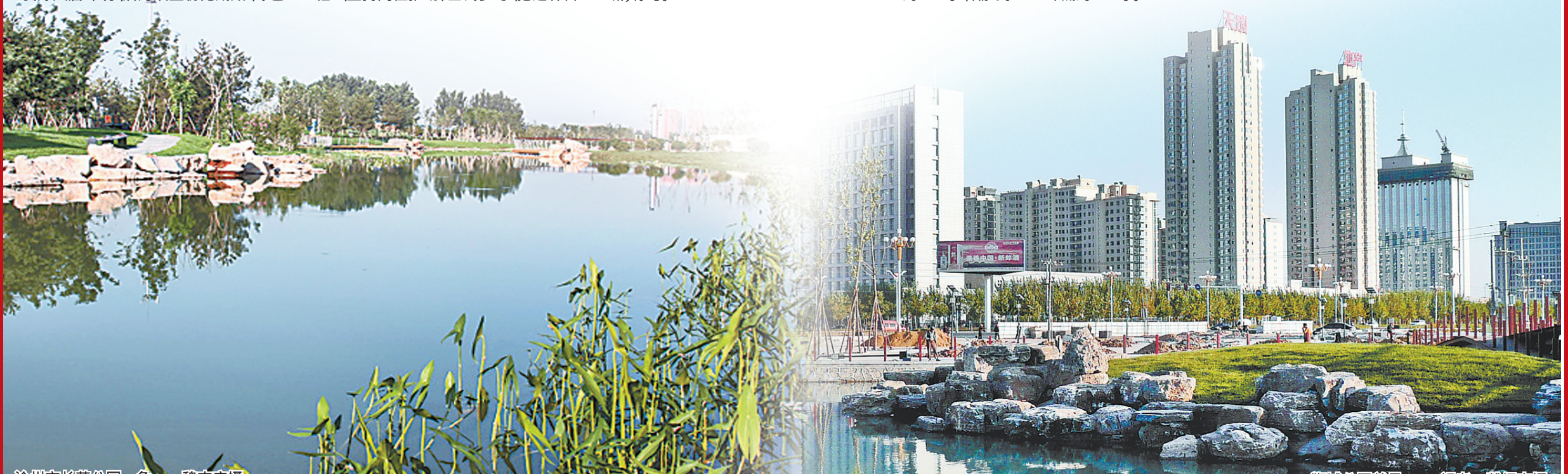
沧州市长芦公园一角。

5年来,全市服务业经济总量逐年上升,服务业增加值由2012年的1014.2亿元增长到2016年的1476.1亿元,年平均增长9.4%,服务业增加值占GDP的比重逐年提高,由2012年的36.1%,上升到2016年的41.8%,提高了5.7个百分点,规模以上服务企业逐年增加,由2012年底的107家增加到2016年底的444家。