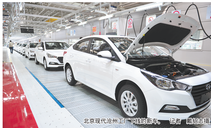
北京现代沧州工厂下线的轿车。

党的十八大以来,沧州在举全省之力打造沿海增长极、加快发展的期许中加速航行,牢固树立和落实新发展理念,主动适应引领经济发展新常态,稳增长、调结构、促改革、治污染,经济社会发展取得新成效。其中,京津冀协同发展国家战略下我省引进的最大体量产业协同项目——北京现代沧州工厂落户沧州,项目建设的速度和效率拿下多项业界第一。