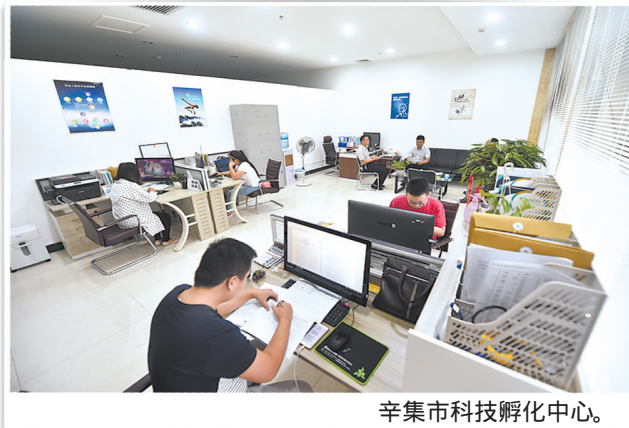
辛集市科技孵化中心。