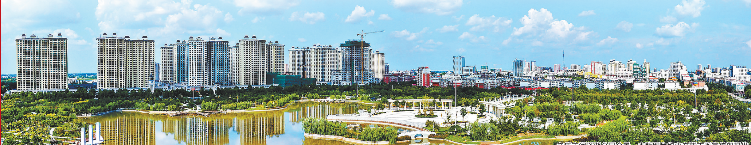
辛集市润泽湖公园全景。

五年的征程波澜壮阔,五年的成果万众共享。特别是通过五年的奋斗攻坚,锻造了一支忠诚干净担当的党员干部队伍,培育了“特别能吃苦、特别能战斗、特别能胜利”的优良工作作风,营造了党风正、政风清的良好政治生态。站在新的历史起点上,我们有决心、有信心把繁荣美丽幸福辛集的美好愿景变成辛集63万人民的现实美好生活,以优异成绩迎接党的十九大胜利召开。