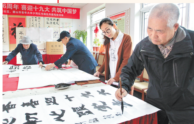
10月18日,唐山市祥富里社区居民在收看十九大开幕会后,现场泼墨挥毫表达喜悦心情。