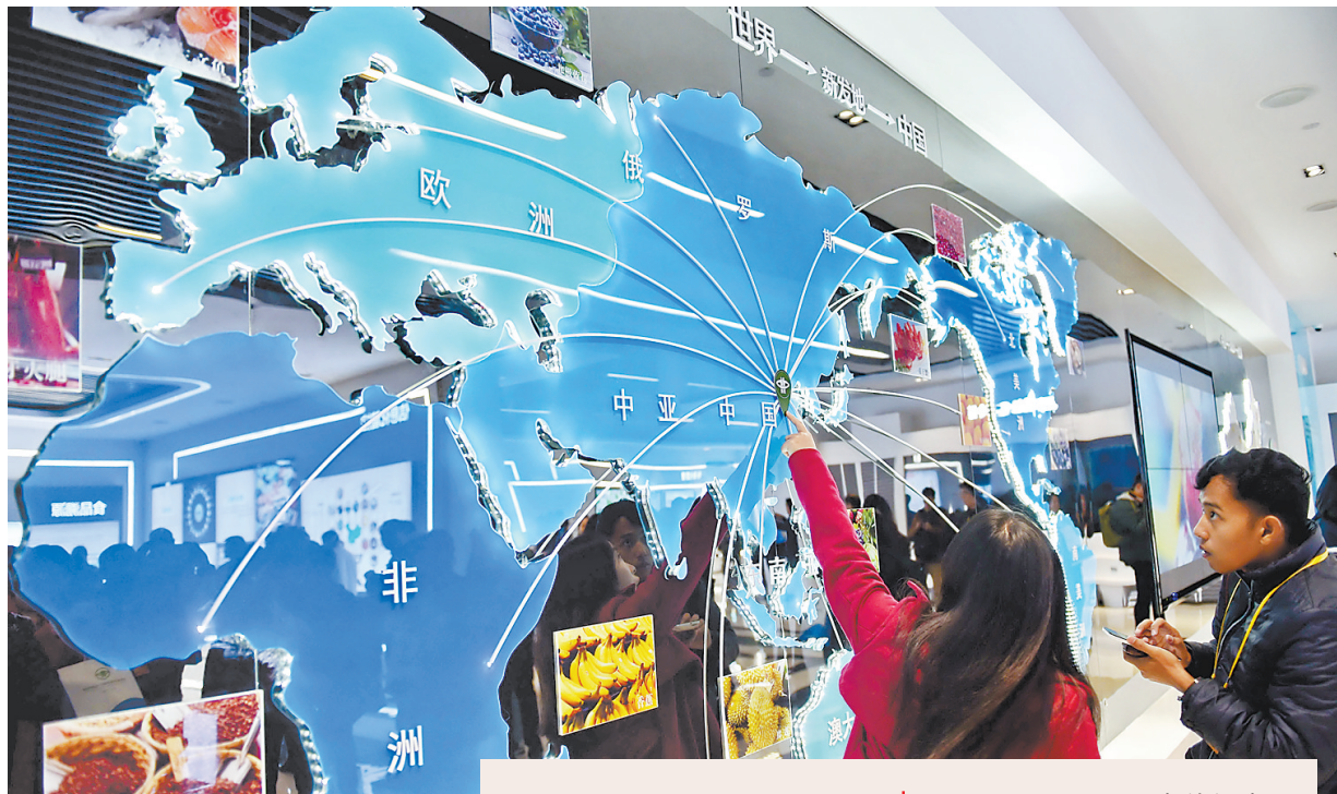
▲10月23日,外国记者在保定高碑店河北新发地农副产品物流园参观采访。 ▼10月22日,中外记者走进廊坊香河国安创客空间参观采访。

干果副食区、粮油区、蔬菜区、水果区分区清晰;检验中心、结算中心、服务中心等功能完善;中央商务区、金融街、特产街等配套设施齐全,走进位于保定高碑店市的河北新发地农副产品物流园,这里集约化、标准化、信息化、智能化的新型交易方式