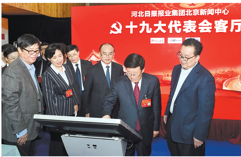
10月23日,省委书记、省人大常委会主任赵克志,省委副书记、省长许勤等在北京看望了参加党的十九大报道的中央驻冀和省直媒体新闻工作者。

来到省直媒体驻地,赵克志、许勤一行首先观看了河北广播电视台新媒体高清转播车,对转播车上24小时全天候辛勤值守的工作人员表示慰问。在长城新媒体集团报道指挥中心,赵克志、许勤通过十九大报道融媒体展示墙,详细了解宣传十九大的系列作品,称赞长城新媒体集团的报道是一道亮丽的风景线。在名为赵克志致全省党员干部的一封信的H5作品前,赵克志高兴地点击发送,并强调全省各级党委(党组)要把学习宣传贯彻党的十九大精神作为首要政治任务。在河北日报报业集团北京新闻中心,30多位编辑记者正在紧张忙碌着。赵克志、许勤走上前与大家一一握手、送上亲切问候。他们通过展板,认真浏览河北日报喜迎十九大重点版面,询问各项报道安排情况。听到河北日报报业集团党委书记、社长于山介绍集团推出的我为祖国升国旗、为党签名祝福H5作品,网友参与人次已经