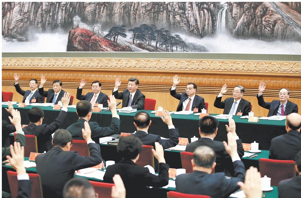
10月23日,中国共产党第十九次全国代表大会主席团举行第四次会议。习近平、李克强、张德江、俞正声、刘云山、王岐山、张高丽等出席会议。

新华社北京10月23日电 中国共产党第十九次全国代表大会主席团22日晚和23日上午在人民大会堂举行第三次和第四次全体会议,通过十九届中央委员会委员、候补委员和中央纪委检查委员会委员候选人名单(草案),提交各代表团酝酿。