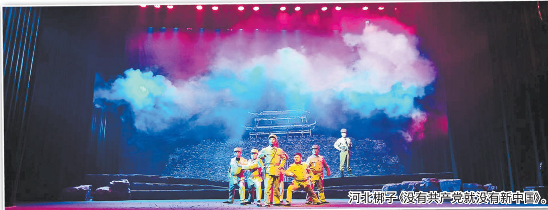
河北梆子《没有共产党就没有新中国》。

家庄的1/2,位居河北省各县(市、区)之首,并相继荣获“中国十大最具投资潜力旅游目的地”“中国最美文化生态旅游名县”和“美丽中国十佳旅游县”等称号,2016年接待游客超1158万人次,旅游总收入81亿元。目前,平山