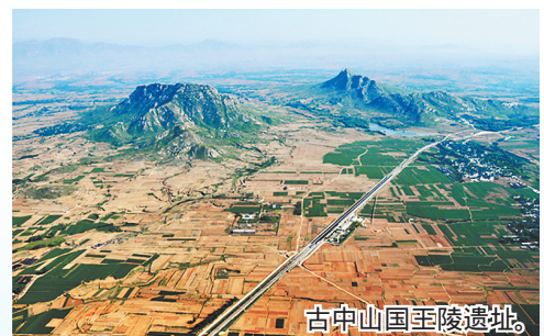
古中山国至陵遗址。