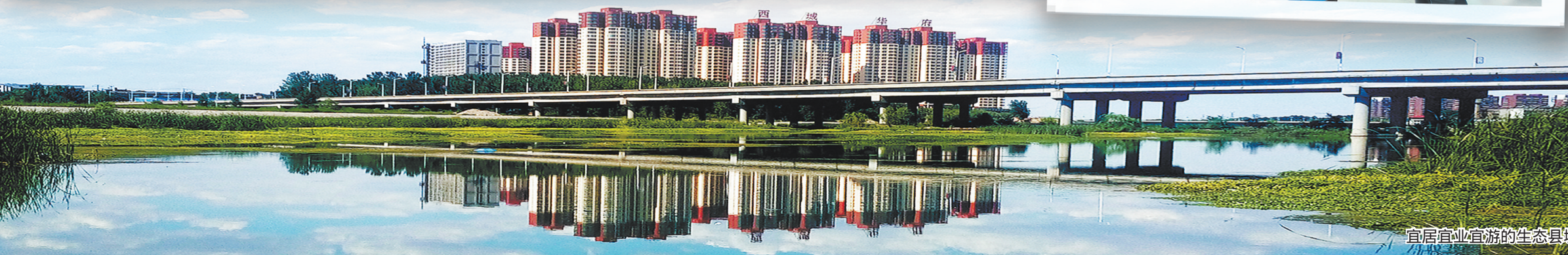
宜居宜业宜游的生态县城。