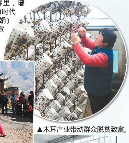
▲木耳产业带动群众脱贫致富。