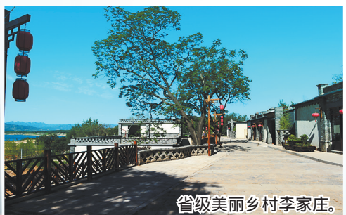
省级美丽乡村李家庄。

据统计,2016年全部财政收入达到21.7亿元,一般公共预算收入首次突破10亿元大关,达到10.8亿元,分别比2011年增长18.6%、30.1%。2017年前三季度,全县完成财政总收入203429万元,同比增长21.9%。