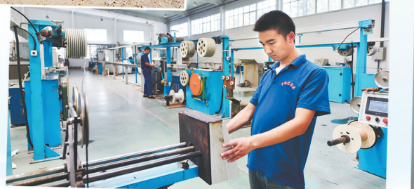
▲河北中联光通信光缆有限公司生产车间。