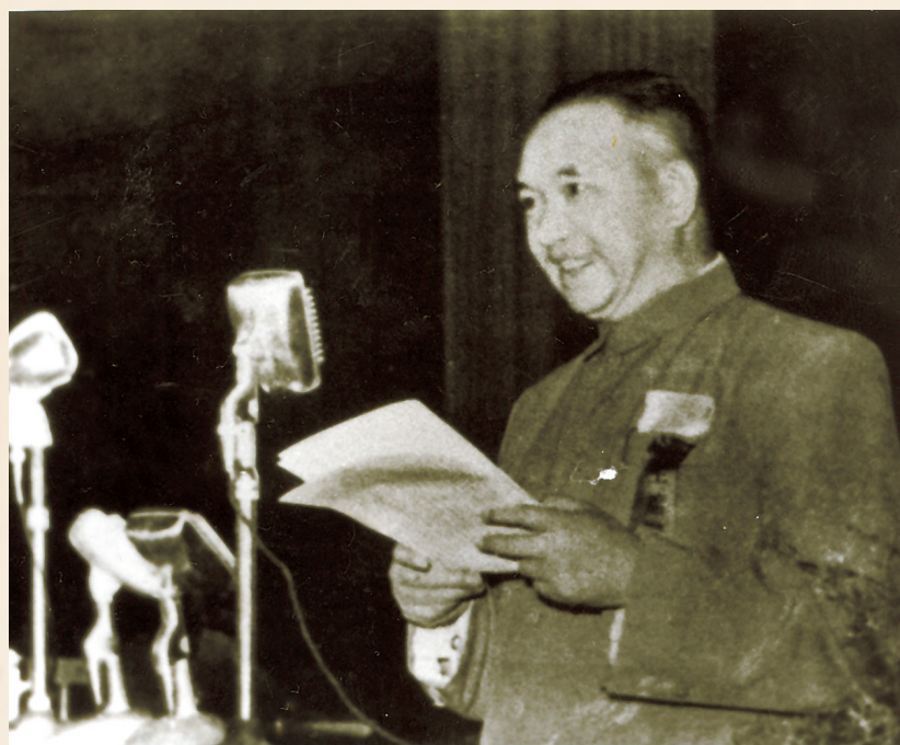
1954年8月,林铁在河北省第一届人民代表大会第一次会议上致开幕词。

林铁,原名刘树德,1904年11月20日出生在四川省万县。于重庆联合中学读书时,受到中共青年运动领导人萧楚女、恽代英的直接影响,积极投身反帝爱国斗争。1925年到北京求学,是年11月加入中国共产党。1928年夏赴法国勤工俭学,以学生身份作掩护,在中国留法学生和工人中开展革命活动。1932年1月到苏联莫斯科列宁学院学习,1933年秋入莫斯科东方大学,接受严格军事训练,并系统学习了马列主义武装斗争理论和苏共武装斗争经验。1935年冬奉调回国,负责中共河北省军事工作。1937年9月,任省委军事部部长,参与了冀东抗日大暴动。1938年2月,任邓华支队政治部主任。4月,调晋察冀根据地,先后任中共晋察冀省委组织部副部长兼民运部长,中共晋察冀区党委委员、常务委员、组织部副部长兼民运部长及青年工作委员会书记,中共中央晋察冀分局组织部副部长兼党校代理校长,中共北岳区党委常委、组织部长兼民运部长、党校校长。1944年10月,任中共冀中区党委书记兼军区政治委员。