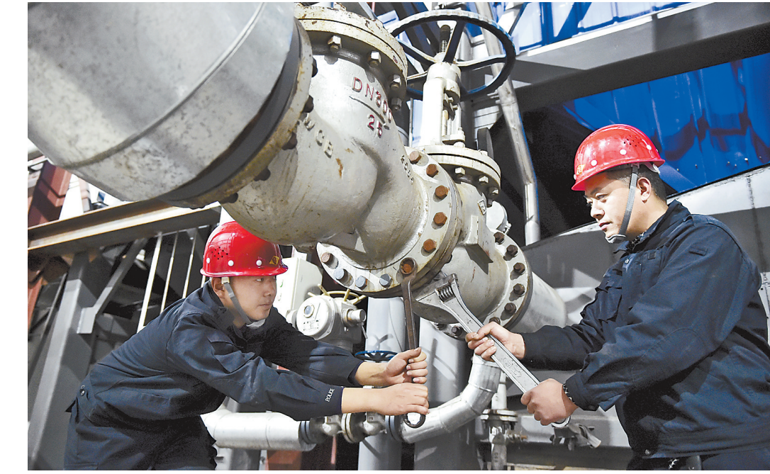
11月21日,阜平县鸿霖热力有限公司的工作人员正对供热设备进行检查。该县加强网络自动化建设,利用网络技术实现换热站远程监控,确保城区集中供热区域安全供热。目前,阜平县主城区202个小区单位和16000个居民散户及商业店铺已实现集中供热,集中供热总面积达到180万平方米。记者 霍艳恩 通讯员 张红伟摄

本报讯(通讯员郭迎春 记者邢杰冉)省气象台预计,受冷空气影响,11月23日,保定、廊坊以北地区风力增大,早晨全省各地最低气温下降1至3。从气温情况看,11月23日,北部设区市(张家口、承德、唐山、秦皇岛)最低气温为-10至-7,中南部设区市为-6至0。24日,北部设区市最低气温为-10至-8,中南部设区市为-6至-1。25日,北部设区市最低气温为-10至-5,中南部设区市为-4至0。