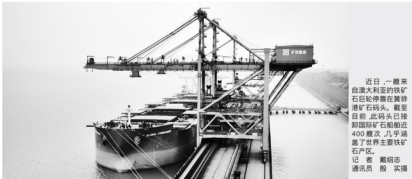
近日,一艘来自澳大利亚的铁矿巨轮停靠在黄骅港矿石码头。截至目前,此码头已接卸国际铁矿石船舶近400艘次,几乎涵盖了世界主要铁矿石产区。

为建立与京津引智工作合作机制,《意见》提出,以承接京津产业转移与功能疏解为契机,加强与京津外专引智部门合作,建立信息发布、政策互通、二次引进和柔性引进的外国人才引进合作机制,大力引进京津高端外国人才和科技成果,降低引智成本,实现资源共享,建立京津高端外国科技成果在沧州转化的合作奖励机制。