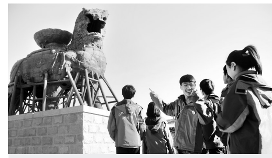
近日,沧州市特殊教育学校组织学生开展了“爱家乡、游沧州”活动。学生们参观了沧州铁狮子、神然生态园等。

正邦养殖项目于今年5月成功落地黄骅市齐家乡杨官庄村。项目总投资8亿元,占地面积近2000亩,主要养殖DLY三元杂交猪,年出栏70万头。该项目将采用公司+农户合作模式运行,公司生产销售方面将带动就业200余人,农户养殖方面将带动1000余户,每户经济产值可达20万至30万元。目前,项目一期今年12月可投产达效。该项目建成后,将成为黄骅市生猪养殖的龙头企业,重点面向京津冀地区,以肉制品市场为导向,以产业化经营为纽带,实现生猪养殖的规模化、产业化和一体化。同时,企业将辐射带动周边屠宰、饲料、猪肉加工等项目建设,进一步延伸产业链条,带动当地养殖业发展。