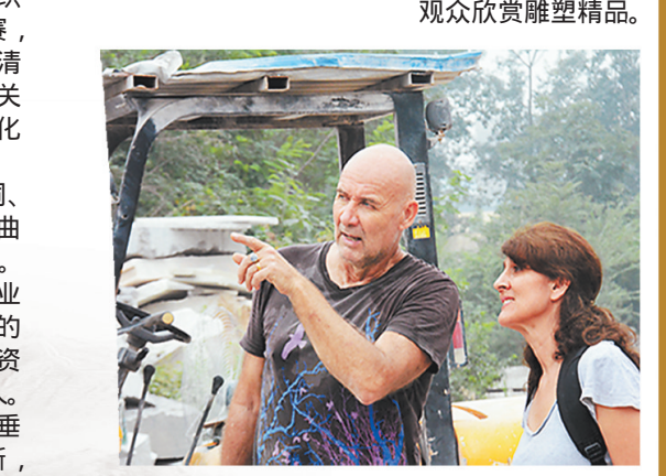
相互交流的国外雕塑家。