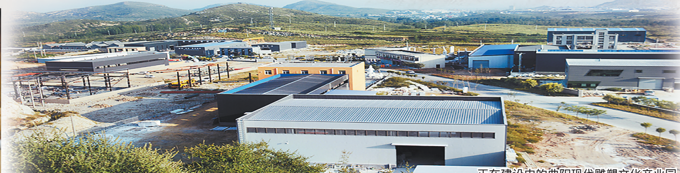
正在建设中的曲阳现代雕塑文化产业园。