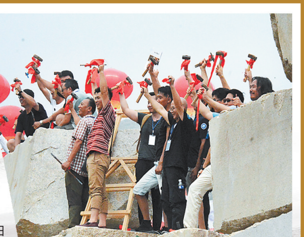
百名雕塑大师现场雕塑。