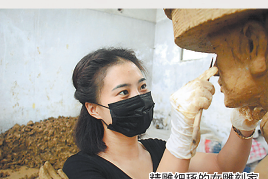
精雕细琢的女雕刻家。

昨夜春风才入户,今朝杨柳半垂堤。厚重的文化底蕴,面向市场的创新,正引领着曲阳文化产业奋力扬帆。