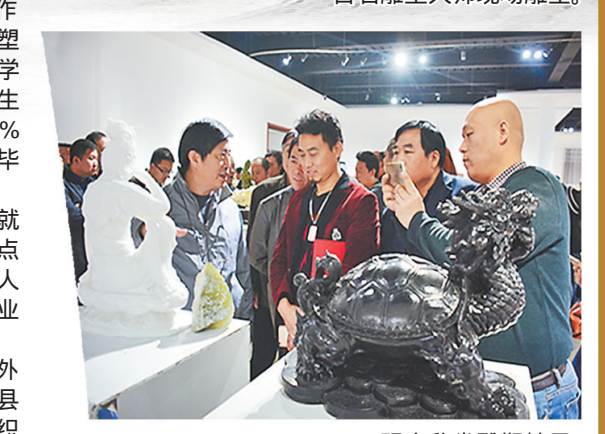
观众欣赏雕塑精品。