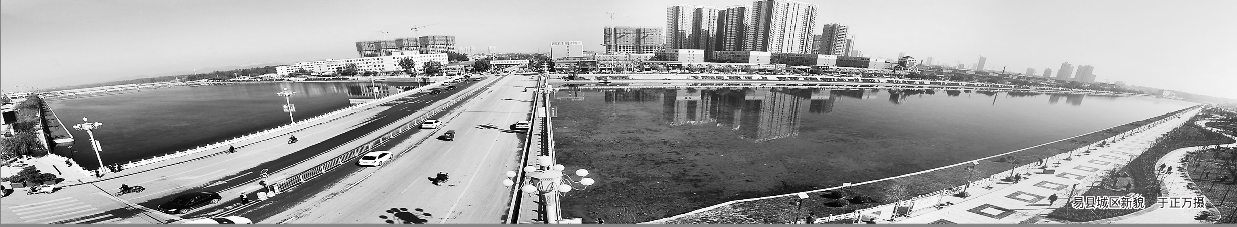
易县城区新貌