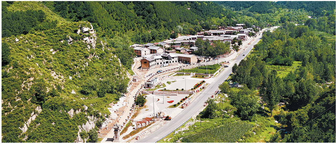
鸟瞰阜平县龙泉关镇骆驼湾村,群山环抱,美景如画。(本报资料片) 记者 田明 赵威摄

北上太行山, 艰哉何巍巍! 在中国迈向全面小康社会的脱贫攻坚战中,阜平,注定会被写下浓重而深情的一笔。 2012年岁末,党的十八大后仅40多天,习近平总书记第二次外出视察,也是第一次赴农村地区视察,就来到老区、山区、贫困地区三区合一的阜平县,冒严寒、踏冰雪看望困难群众,共商脱贫之策。 在这里,总书记向全党全国发出了脱贫攻坚的进军令,没有农村的小康,特别是没有贫困地区的小康,就没有全面建成小康社会。 在这里,总书记鼓励干部群众:只要有信心,黄土变成金! 阜平,中国第一个敌后抗日民主根据地诞生的红色热土,中国第一声决胜脱贫攻坚战号角吹响的激情战场。 五年间,20多万阜平干部群众牢记总书记的嘱托,汗水和泥,苦干实干,谱写了一曲革命老区奋力脱贫攻坚的慷慨壮歌。 推进扶贫开发、推动经济社会发展,首先要有一个好思路、好路子。 产业扶贫重精准,让干等着的群众干起来,扶贫造血,气血十足。