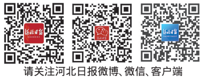
请关注河北日报微博、微信、客户端

会见后,习近平与参加中日执政党交流机制第七次会议部分日方代表合影留念。 杨洁篪参加上述活动。 由中国共产党和日本自民党、公明党共同举办的中日执政党交流机制第七次会议于12月25日至26日在福建厦门、福州举行,会议通过了《中日执政党交流机制第七次会议共同倡议》。