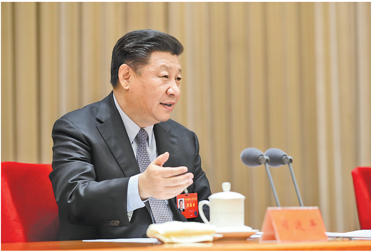
12月28日至29日,中央农村工作会议在北京举行。中共中央总书记、国家主席、中央军委主席习近平在会上发表重要讲话。

会议指出,党的十八大以来,习近平总书记就做好“三农”工作作出了一系列重要论述,提出了一系列新理念新思想新战略,这些新理念新思想新战略是我们党“三农”理论创新的最新成果,是习近平新时代中国特色社会主义思想的重要组成部分,是指导过去5年我国农业农村发展取得历史性成就、发生历史性变革的科学理论,也是实施乡村振兴战略、做好新时代“三农”工作的行动指南,我们要深入学习领会,并深入贯彻到乡村振兴的具体实践中。一是坚持加强和改善党对农村工作的领导,为“三农”发展提供坚强政治保障;二是坚持重中之重战略地位,切实把农业农村优先发展落到实处;三是坚持把推进农业供给侧结构性改革作为主线,加快推进农业农村现代化;四是坚持立足国内保障自给的方针,牢牢掌握国家