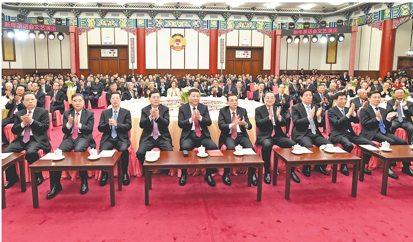
12月29日,全国政协在北京举行新年茶话会。党和国家领导人习近平、李克强、张德江、俞正声、张高丽、栗战书、汪洋、王沪宁、赵乐际、韩正出席茶话会并观看演出。

新华社北京12月29日电(记者张晓松、姜潇)中国人民政治协商会议全国委员会12月29日上午在全国政协礼堂举行新年茶话会。党和国家领导人习近平、李克强、张德江、俞正声、张高丽、栗战书、汪洋、王沪宁、赵乐际、韩正等同各民主党派中央、全国工商联负责人和无党派人士代表,中央和国家机关有关方面负责人以及首都各族各界人士代表欢聚一堂,共迎2018年元旦。