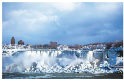
1月2日的尼亚加拉大瀑布。

据新华社纽约1月2日电(记者王文)受来自北极的强冷空气影响，美国东部多地2日迎来罕见低温。