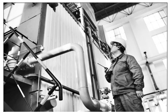
连日来,廊坊出现大风降温天气,廊坊开发区各供热企业组织专业人员定时对锅炉及其附属设备、外网供热管线及换热站进行巡检。他们还每天随机抽取居民小区进行入户测温,保证室温达到国家标准。这是开发区热力供应中心第四供热站工作人员在对燃气锅炉管道进行检测。

国家生态工业示范园区建设只有起点,没有终点。廊坊市委常委、开发区党委书记王金忠表示,作为我省第一家通过国家级生态工业示范园区验收的开发区,他们将一如既往地发展循环经济、低碳经济和生态工业,促进生态环境质量持续改善,为河北省乃至京津冀地区生态文明建设发挥示范引领作用,力促经济实现质量更优发展。