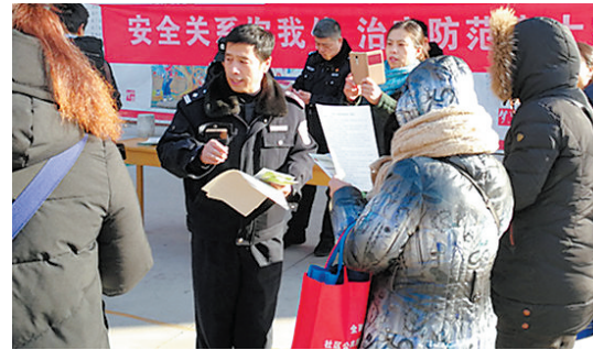
为提高辖区居民的治安防范意识,日前石家庄市裕华路派出所民警深入部分小区,开展以防火、防盗、防诈骗为主题的治安消防宣传活动。现场向居民宣讲有关安全防范知识。

针对老年人多慢性病对手术的影响,张英泽团队探索通过减少手术对老年人机体刺激,进一步降低手术风险,在综合考虑老年人的病情基础上制定最佳治疗方案,微创手术,无创麻醉,同时做好围手术期的管理。