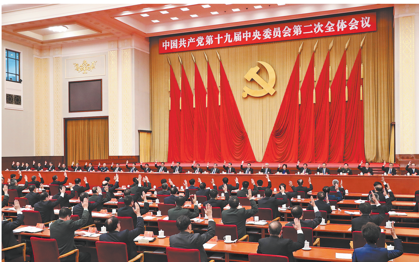
中国共产党第十九届中央委员会第二次全体会议,于2018年1月18日至19日在北京举行。中央政治局主持会议。