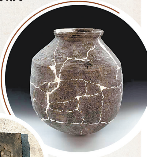
▲南阳遗址出土陶器。

不仅如此,正定开元寺南广场遗址的考古发掘也令人振奋。该遗址发掘面积1035平方米,目前已发现唐、五代、北宋等7个历史时期的文化层叠压,出土