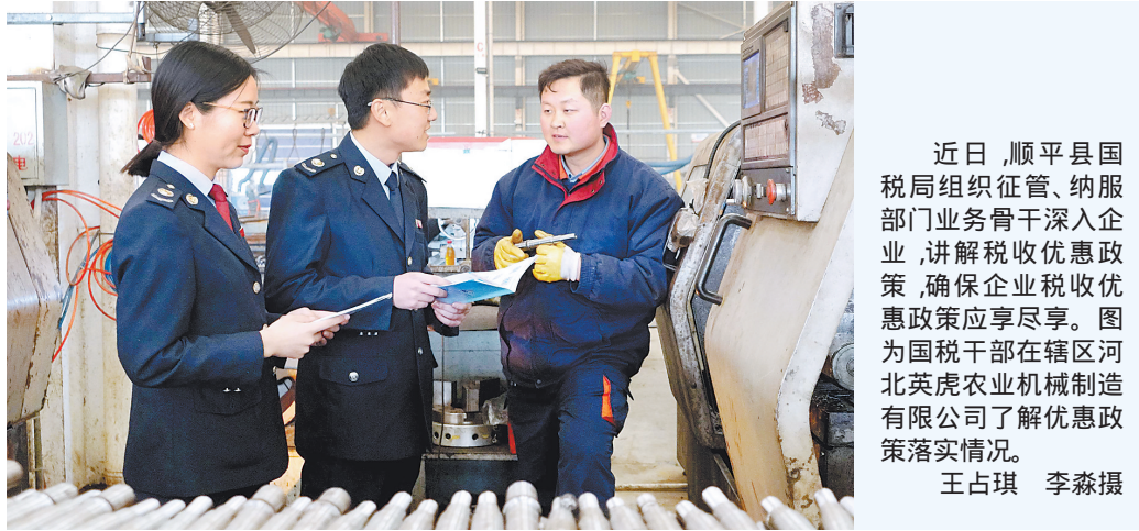
近日,顺平县国税局组织征管、纳税服务等部门业务骨干深入企业,讲解税收优惠政策,确保企业税收优惠政策应享尽享。图为国税干部在辖区河北英虎农业机械制造有限公司了解优惠政策落实情况。

策范围内精简审批环节,优化服务流程,先后推出7类47项涉税事项全市通办、4类11项全省通办,优化8类25项办税流程。引入“互联网+”理念,增配自助办税终端24台,选取4个县区试运行“智慧云办税厅”2.0版,与税务部门推进“一窗一人一机单系统”联合办税模式,解决纳税人“两头跑、多次跑”问题,全面提高减免税办税效率。同时,为防止违规事前备案或变相审批,该局还加大税收优惠政策执行情况跟踪检查力度,强化数据监控,以信息管税为抓手,利用税源管理平台、综合治税平台、减免税管理系统等数据信息,进行预警分析,对筛选出的疑点企业开展专项评估,强化后续管理,为享受优惠政策的纳税人提供公平公正的营商环境。(付振宇、高小杰)