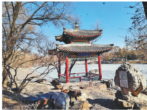
修缮后的避暑山庄景点 芳泽临流。

一座山庄 半部清史。作为中国最后一个封建王朝在塞外精心营造的皇家园林，三百年来，承德避暑山庄几度兴废。2010年8月，一项中华人民共和国成立以来投资额最大的单项文物保护工程——避暑山庄及周围寺庙文化遗产保护工程，正式启动实施。该工程由中央财政投入6亿元专项资金，是中国继西藏布达拉宫历史建筑群保护工程、长城保护工程之后的又一重大文物保护工程。