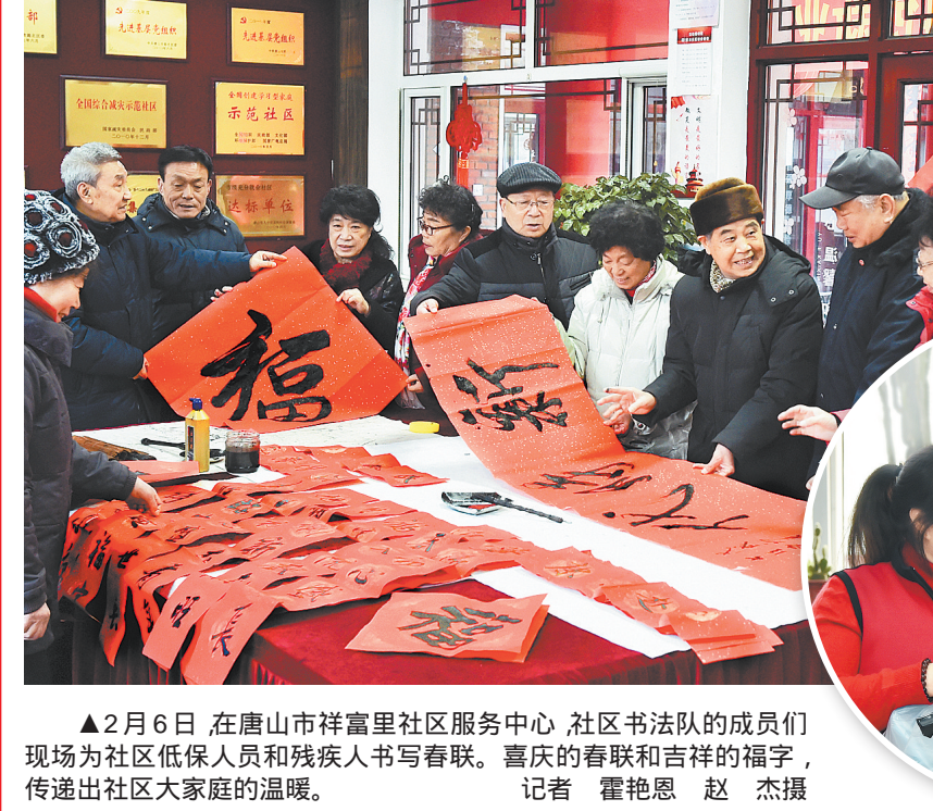
▲2月6日,在唐山市祥富里社区服务中心,社区司法队的成员们现场为社区低保人员和残疾人书写春联。喜庆的春联和吉祥的福字,传递出社区大家庭的温暖。