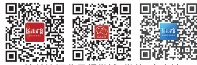
请关注河北日报微博、微信、客户端