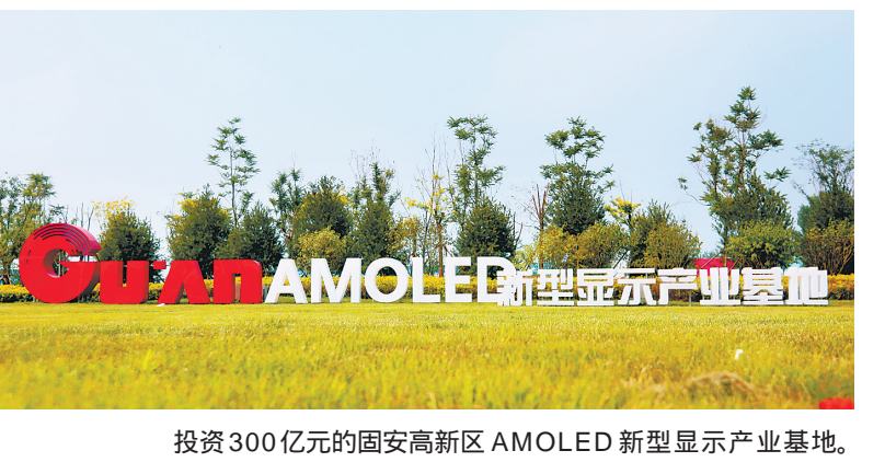
投资300亿元的固安高新区AMOLED新型显示产业基地。

聚焦国际先进、国内领先，新型显示产业的“固安军团”已整装出发，向着构建世界级新一代OLED显示产业集群的远大目标，他们加速前行！