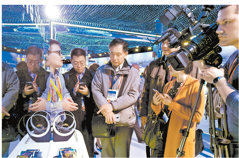
2月26日，云谷(固安)核心技术团队携世界领先水平的AMOLED柔性显示技术亮相巴塞罗那世界移动大会。

体。凭借一个个国内领先、国际一流的创新成果，翌光科技在OLED汽车照明的研发及应用，已经走在了世界